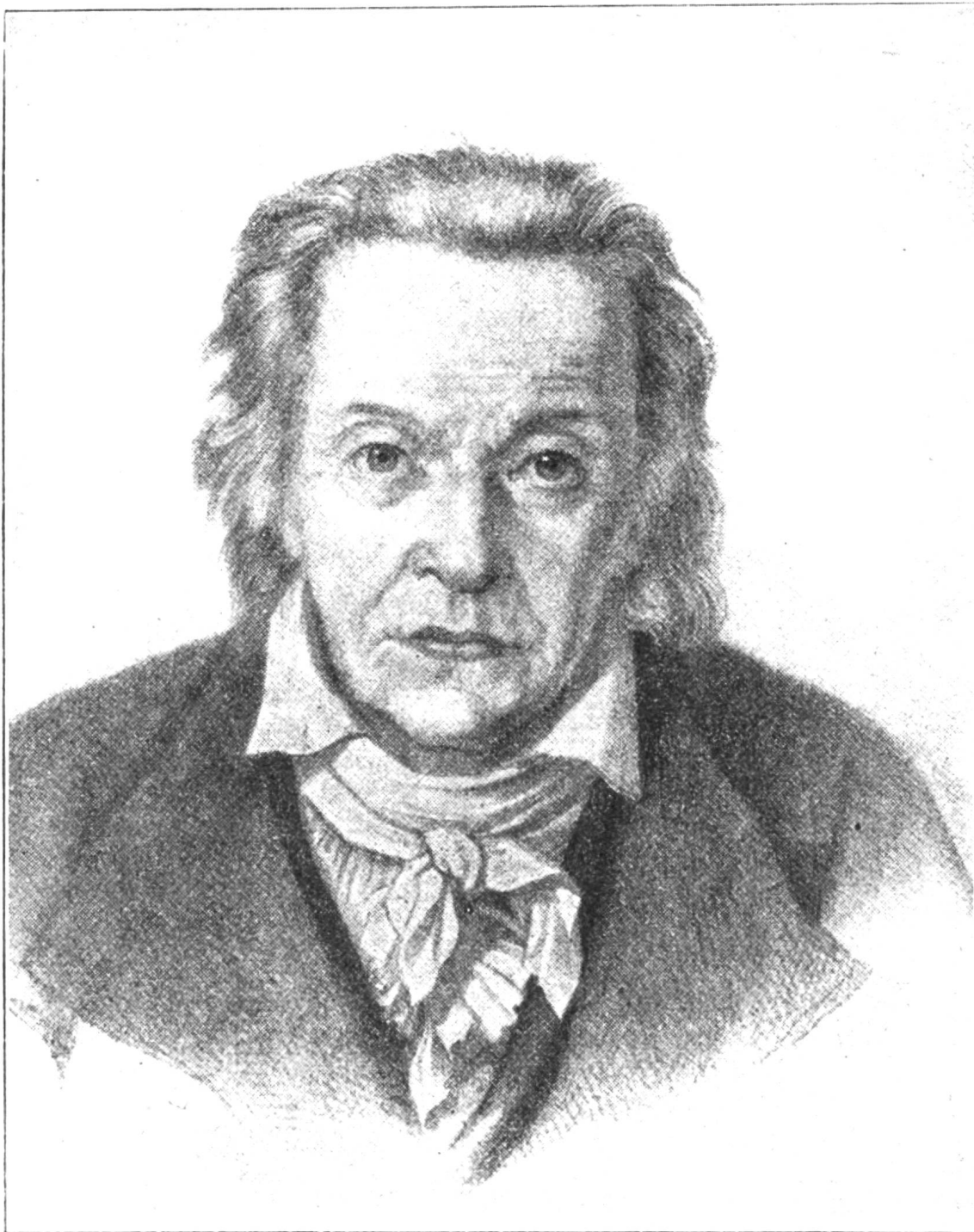
Johann Heinrich Pestalozzi im Alter von 72 Jahren. Nach dem Leben gezeichnet.