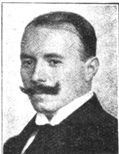
Dr. Jean Musy von Albeuve, Freiburg * 1876, seit 1920 i. Amte