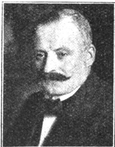
Dr. Giuseppe Motta von Airolo * 1871, seit 1912 i. Amte