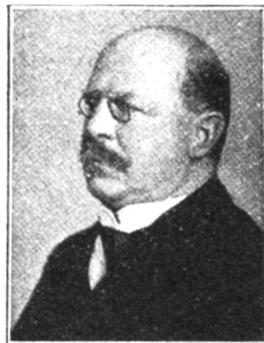
Karl Scheurer von Erlach * 1872, seit 1920 i. Amte

Dr. Motta: Chef d. Po- litischen Departements. Dr. Chuard: Chef d. De- partements des Innern. Häberlin: Chef d. Justiz- u. Polizeidepartements. Scheurer: Chef des Mi- litärdepartements. Dr. Musy: Chef des Finanz- und Zolldepartements. Schulthess: Chef d. Volks- wirtschaftsdepart. Dr. Haab: Chef d. Post-u. Ei- senbahndepartements.