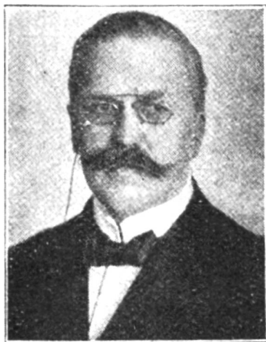
Edm. Schulthess von Brugg * 1868, seit 1912 i. Amte

Dr. Motta: Chef d. Po- litischen Departements. Dr. Chuard: Chef d. De- partements des Innern. Häberlin: Chef d. Justiz- u. Polizeidepartements. Scheurer: Chef des Mi- litärdepartements. Dr. Musy: Chef des Finanz- und Zolldepartements. Schulthess: Chef d. Volks- wirtschaftsdepart. Dr. Haab: Chef d. Post-u. Ei- senbahndepartements.