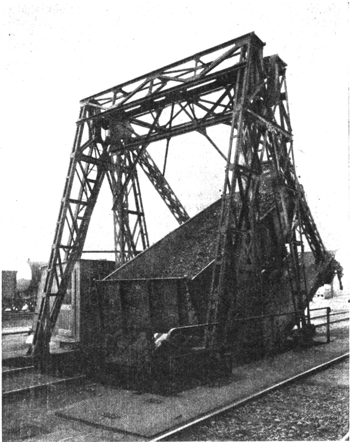
Der Wagentipper, eine Vorrichtung, welche das zeitraubende Ausladen mit Schaufeln überflüssig macht. Solche Apparate sind im Gebrauch bei Gasfabriken, zum Entleeren der Kohlenwagen.