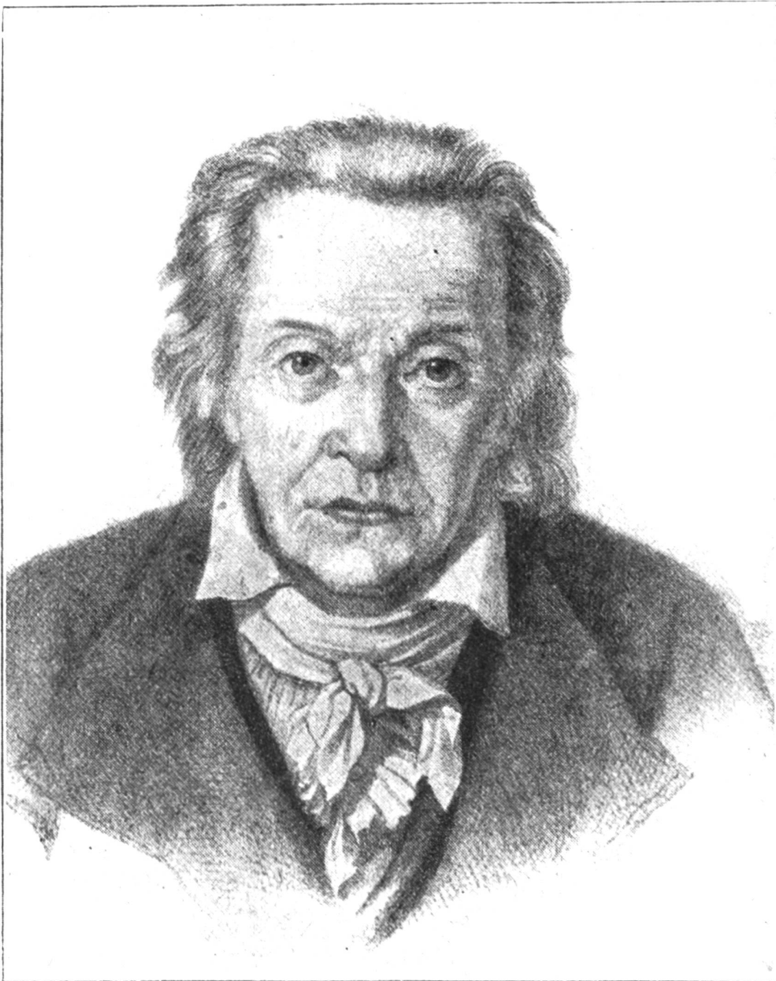
Johann Heinrich Pestalozzi im Alter von 72 Jahren. Nach dem Leben gezeichnet.