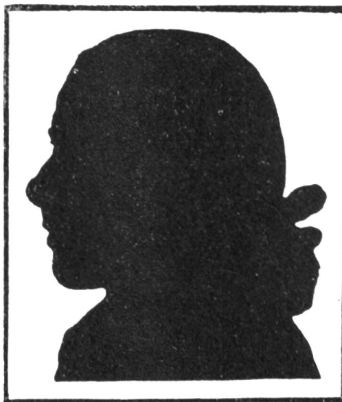
Pestalozzi als Jüngling.

Pestalozzi hat bewiesen, was unerschütterliche Liebe und Herzensgüte vermag; es ist dies