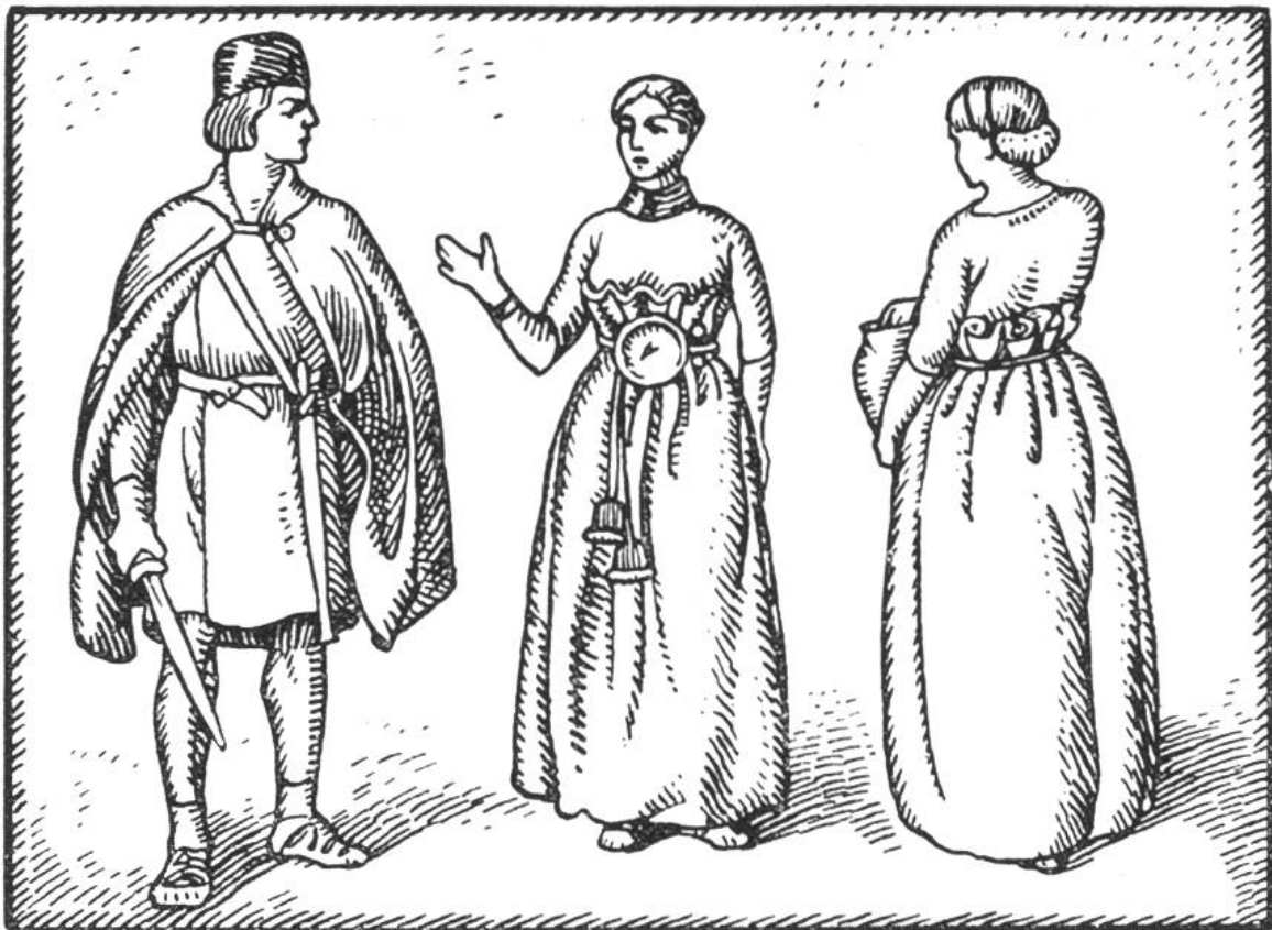
Kleider aus der Pfahlbauzeit.