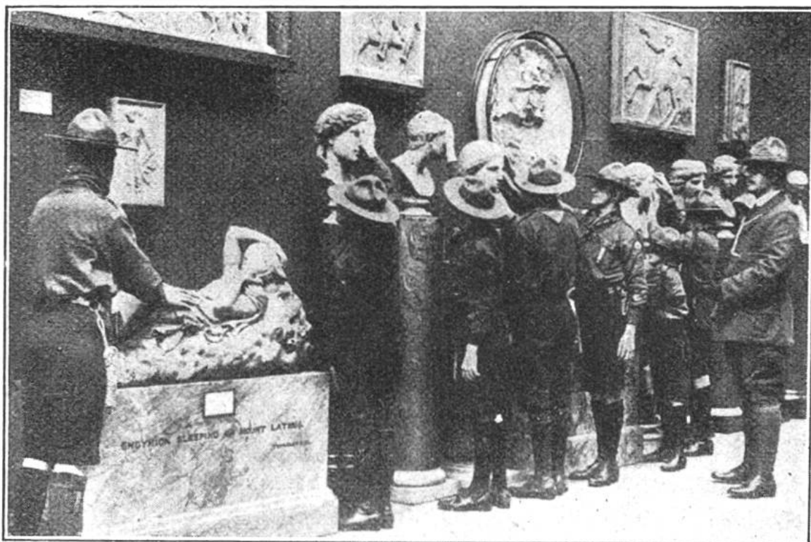
Blinde Pfadfinder studieren in einem englischen Museum antike Bildhauerkunst.