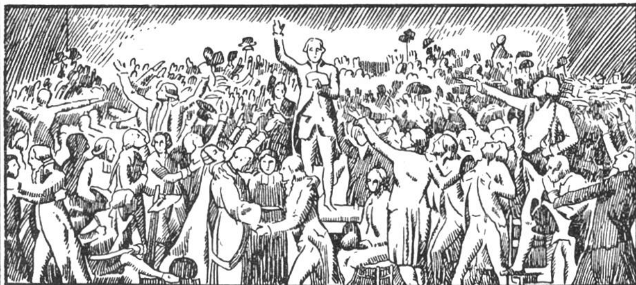
Der Schwur im Ballspielhause am 20. Juni 1789.