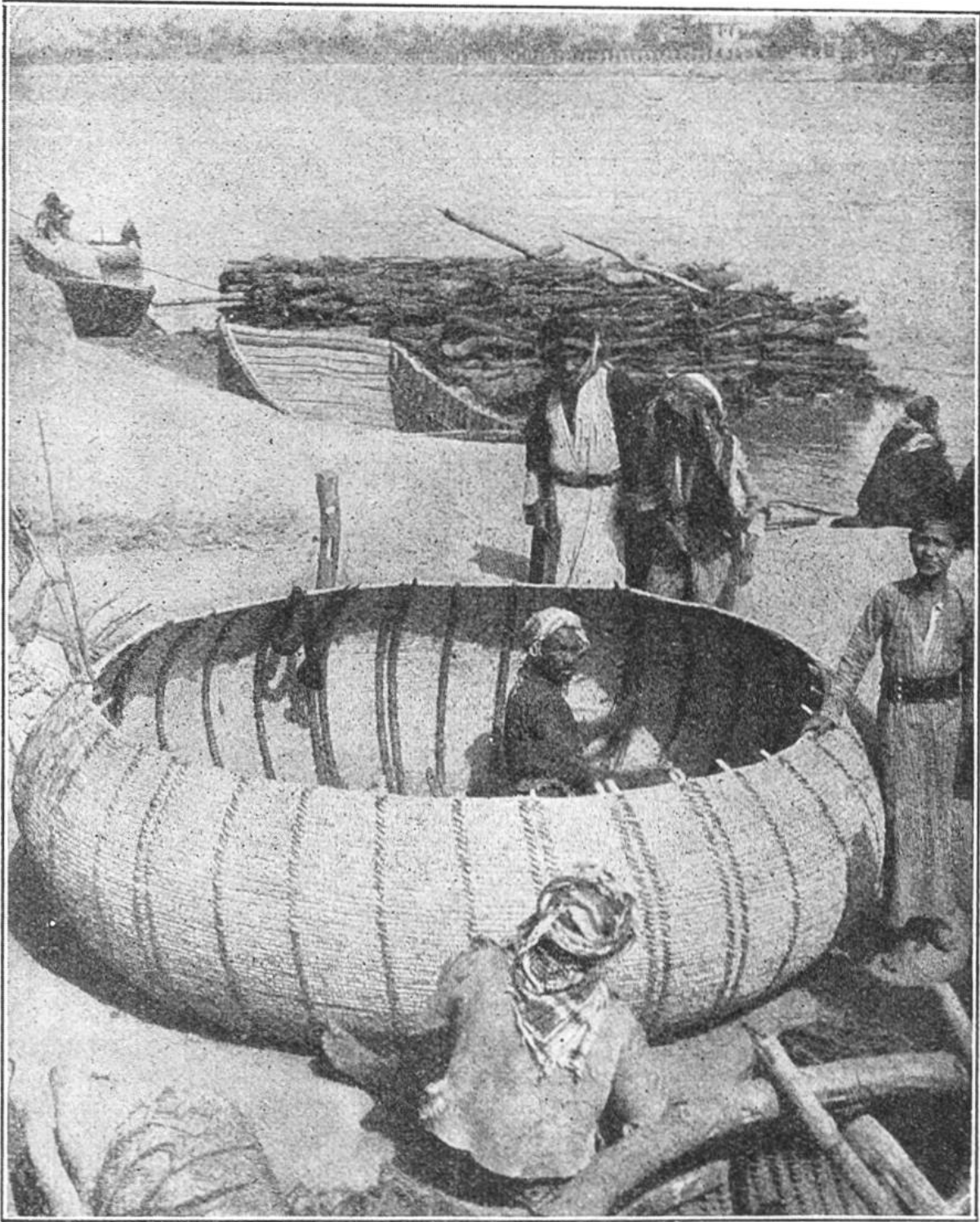
Eine Kunst, die sich seit Jahrtausenden vererbt hat: Schiffer am Tigris bauen ein Korbboot.