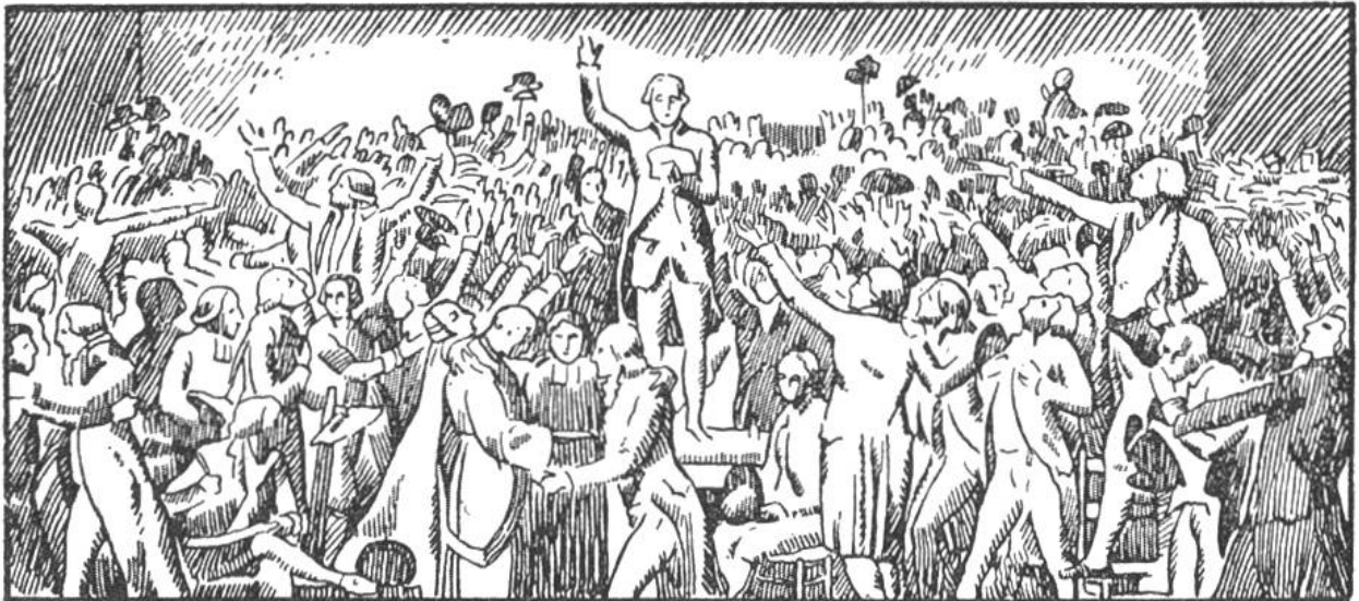
Der Schwur im Ballspielhause am 20. Juni 1789.

1675 Der große Kurfürst schlägt die Schweden b. Sehrbellin. 1689—1725 Zar Peter der Große macht Rußland zu einer europäischen Großmacht. 1700—1721 Nordischer Krieg. Peter der Große von Rußland, Sachsen, Polen u. Dänemark geg. Karl XII. v. Schweden. 1701—1714 Span. Erbfolgekrieg. 1712 Zweiter Villmergerkrieg, Niederlage der katholischen Orte. 1713 Friede zu Utrecht. 1714 Friede zu Rastatt. 1740 Friedrich II., d. Große, König von Preußen u. Maria Theresia, Kaiserin v. Österreich. 1749 Habsburger in Bern. 1756—1763 Siebenjähriger Krieg. Preußen behält Schlesien. Frankreich tritt Kanada an England ab. 1761 Gründung der Helvetischen Gesellschaft. Iselin, Balthasar, Hirzel, Zimmermann, Salis, Haller, Geßner, Lavater, Pestalozzi, Joh. v. Müller. 1766 Lothringen und Korsika werden französisch.