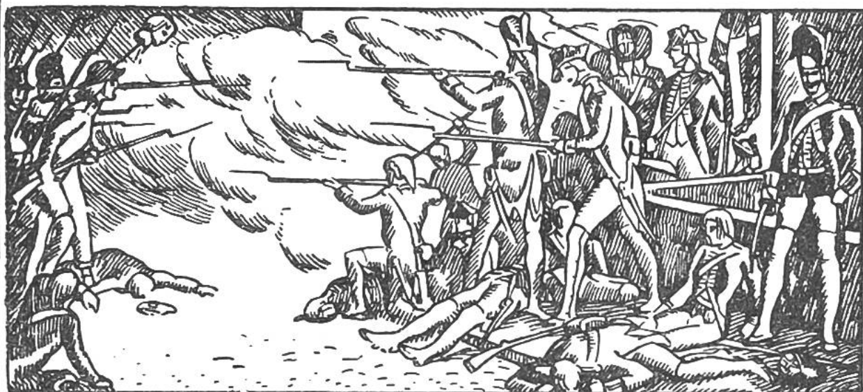
Verteidigung der Tuilerien durch die Schweizergarde.