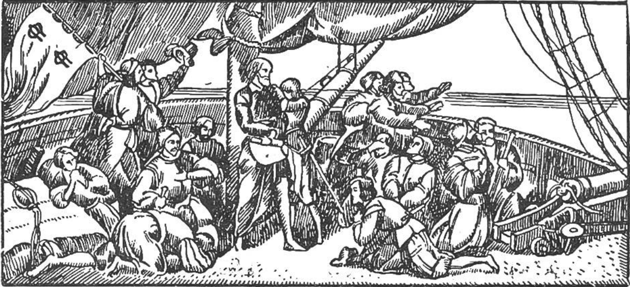
Kolumbus und seine Gefährten angesichts Land.

1478 Schlacht bei Giornico, Srischans Theiling. 1481 Stanzer Verkommnis, Nikolaus von der Flüe als Friedensstifter. Freiburg u. Solothurn werden in den eidgenössisch. Bund aufgenommen.