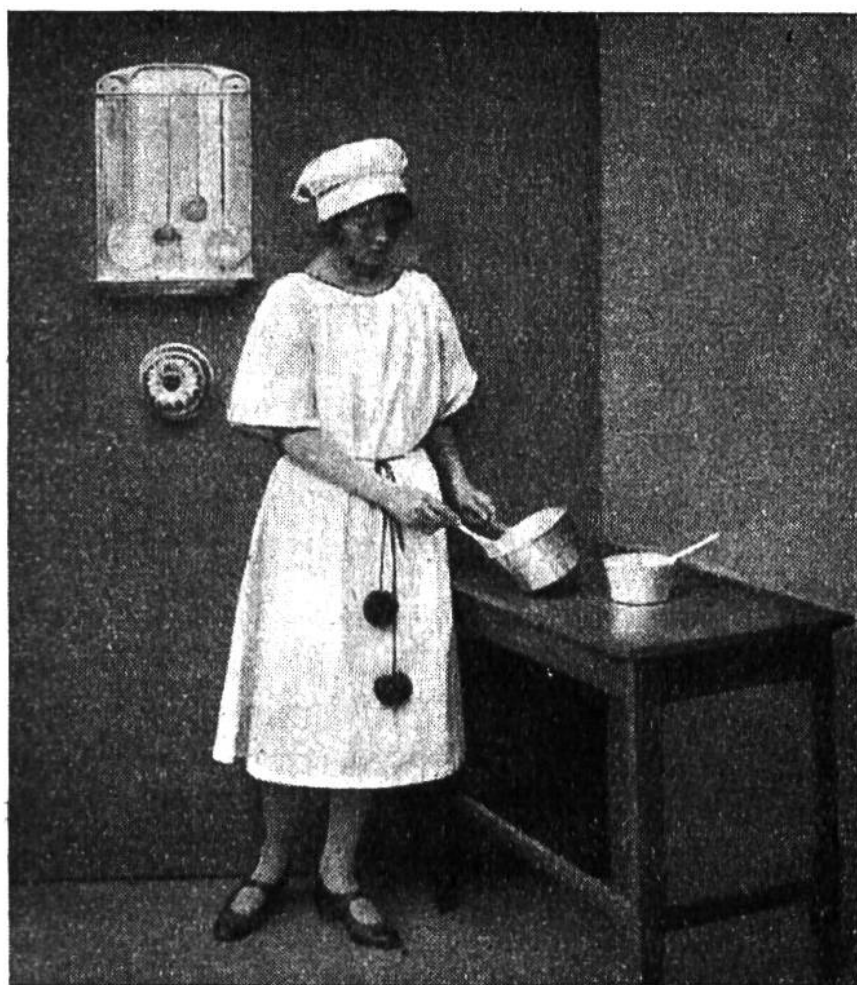
„Hausmütterchen“ in der Küche.

wird genau in derselben Form geschnitten wie die Passe. — Zum Schließen des Cape näht man an der Passe 3—4 Häfen und Ösen an.