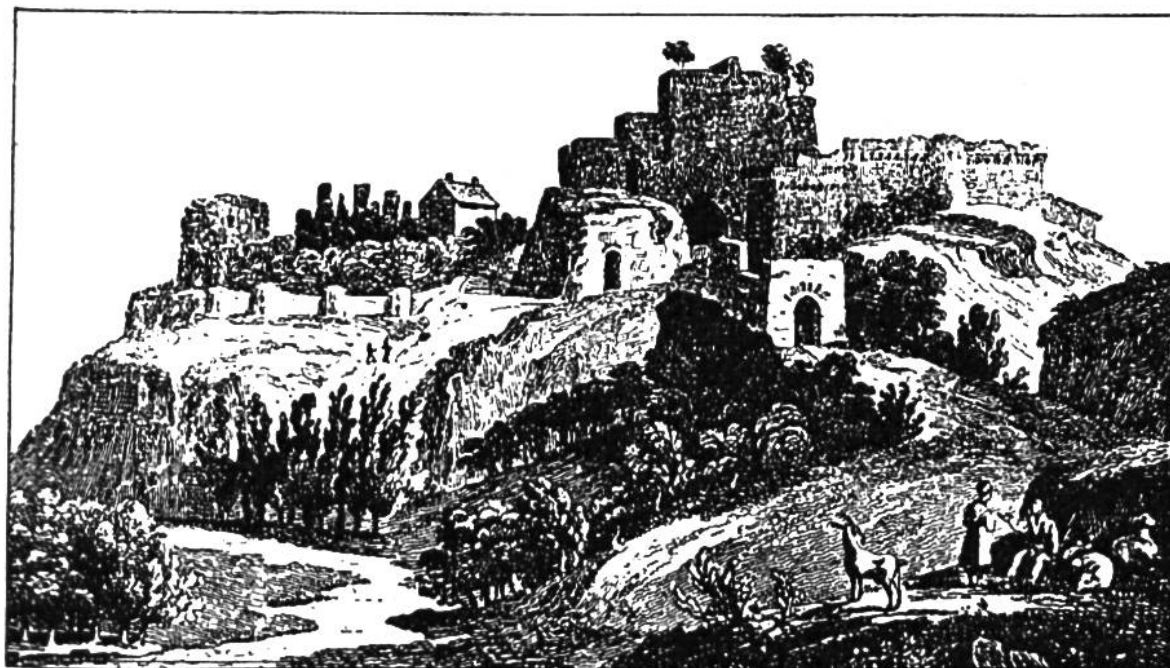
Schloß Tiffauge, wo Ritter Blaubart Alchimie betrieb, um sich Gold zu verschaffen.

von Orléans und empfing, kaum 25 jährig, den Marschallstab von Frankreich als Belohnung für seinen Heldenmut. In Friedenszeiten lebte Gilles de Rais auf seinen ausgedehnten Gütern. Sein Reichtum war sprichwörtlich im Land und sein Hofstaat stand an Pracht und Glanz dem des Königs nicht nach. Mit fürstlicher Gastfreundschaft hieß er das Volk zu seinen glanzvollen Festen willkommen, wo sich die Ritter im Waffenspiel maßen und der Listbarkeiten kein Ende war. An reich besetzter Tafel durfte jeder schmausen nach Herzenslust und trinken vom feinsten Wein. Gilles de Rais wollte, daß seine Festlichkeiten alles überstrahlten. Lange hielten die Reichtümer des jungen Adels Herrn hin; aber es brach der Tag an, wo sie zur Neige gingen und der verschwenderische Geber in Bedrängnis kam. Jetzt begann er seine Besitzungen zu verkaufen, Stück um Stück. Doch es half nicht viel, denn mit vollen Händen gab er aus wie zuvor. Da spielte ihm der Zufall eine alte Schrift in die Hände. „Alchimie“ stand darauf. In sie vertiefte sich Gilles de Rais und es reifte der Plan in ihm, Gold herzustellen. Von überall her kamen nun „Alchimisten“ und es begann ein geheimes Treiben im Schloß Tiffauge; in hellen Mondnächten hörte man die Goldsucher laut die Dämonen beschwören. In der Umgebung des Schlosses ging ein Gerücht, leise zuerst und unbestimmt: