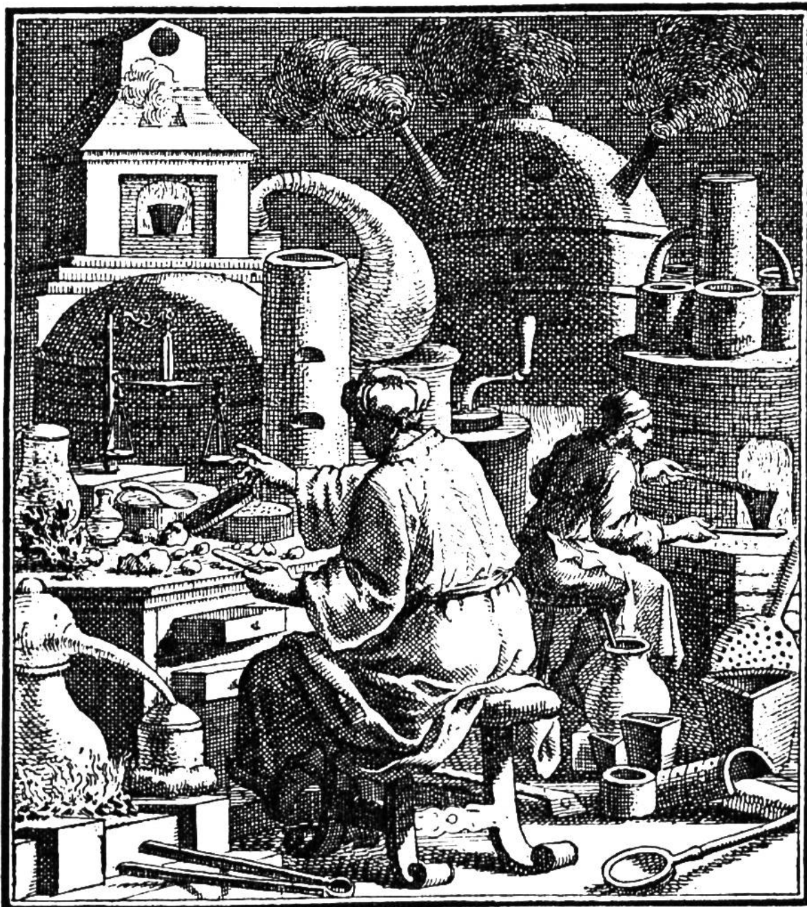
Der Goldmacher in seiner Behausung, umgeben von phantastisch geformten Gefäßen.

gereien Eingang in die Alchimie. Fürstliche Herren suchten ihren durch Mißwirtschaft und Verschwendung bedrohten Haushalt auf bequeme Art wieder herzustellen, indem sie selbst zur Goldbeschaffung Alchimie betrieben oder Leute anstellten, die sich „Alchimisten“ nannten, gewöhnlich aber abgefeimte Betrüger waren.