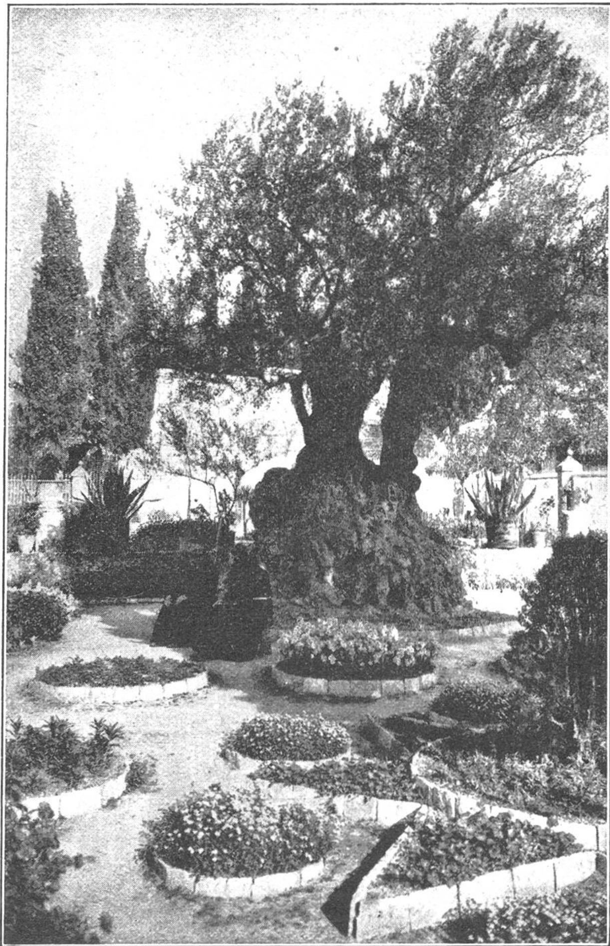
Der Garten Gethsemane, wo Jesus Christus in der Nacht vor seiner Gefangennahme ruhte.