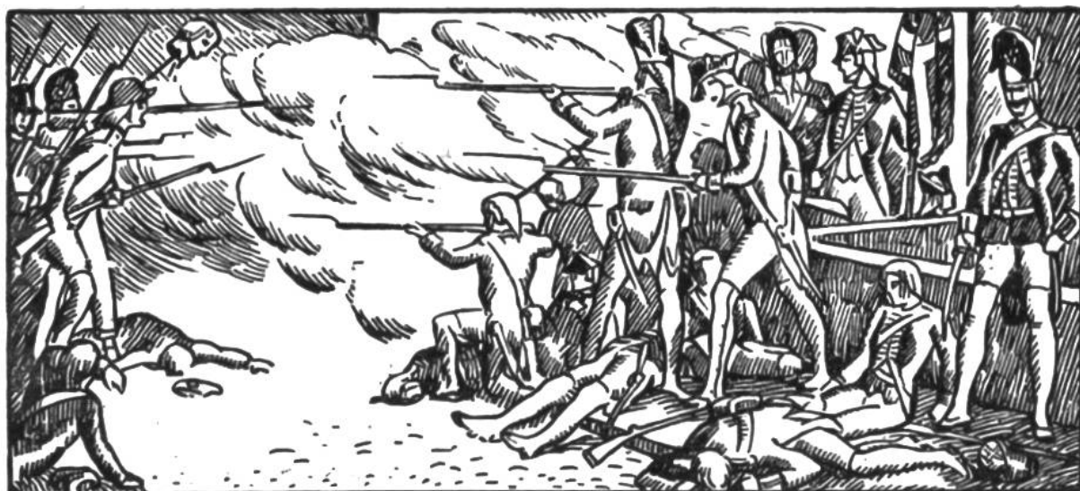
Verteidigung der Tuileries durch die Schweizergarde.

1689—1725 Zar Peter der Große macht Rußland zu einer europäischen Großmacht. 1700—1721 Nordischer Krieg. Peter der Große von Rußland, Sachsen, Polen und Dänemark gegen Karl XII. von Schweden. 1701—1741 Span. Erbfolgekrieg. 1712 Zweiter Villmergerkrieg, Niederlage der katholischen Orte. 1713 Friede zu Utrecht. 1714 Friede zu Rastatt. 1740 Friedrich II., d. Große, König von Preußen u. Maria Theresia, Kaiserin v. Österreich. 1749 Habsburgerthron in Bern. 1756—1763 Siebenjähriger Krieg. Preußen behält Schlesiens. Frankreich tritt Kanada an England ab. 1761 Gründung der Helvetischen Gesellschaft. Iselin, Balthasar, Hirzel, Zimmermann, Salis, Haller, Gehner, Lavater, Pestalozzi, Joh. v. Müller.