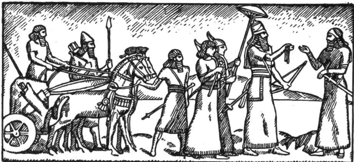
Assyrischer König mit Gefolge.