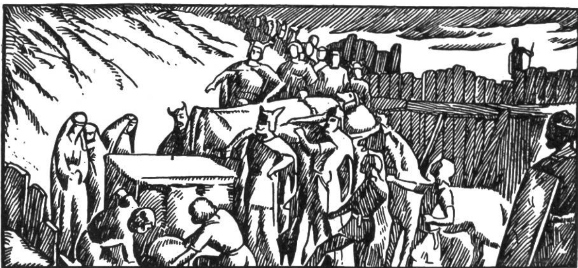
Bestattung Alarichs im Busento.