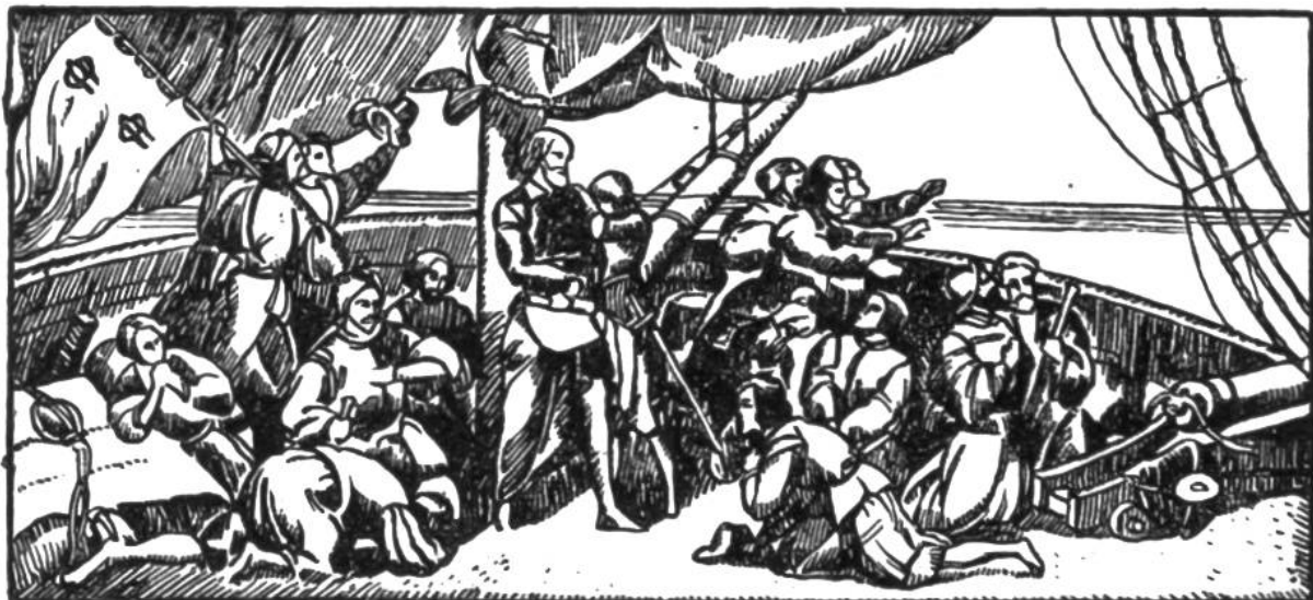
Kolumbus und seine Gefährten angesichts Land.

1481 Stanser Verkommnis, Nikolaus von der Flüe als Friedensstifter. Freiburg u. Solothurn werden in den eidgenössisch. Bund aufgenommen.