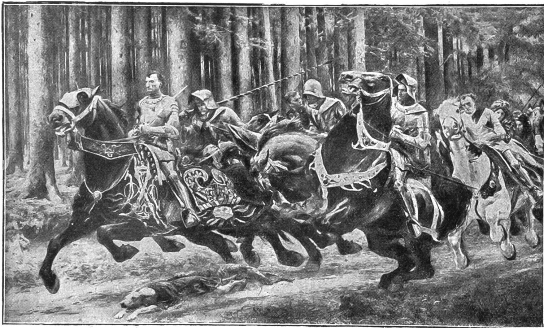
Die Flucht Karls des Kühnen. Gemälde von Eugène Burnand. Gott- fried-Keller-Stiftung, Museum Lausanne.