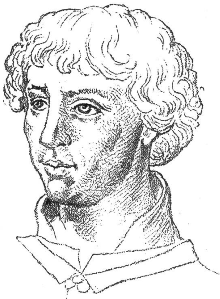
Karl der Kühne von Burgund. Zeitgenössische Zeichnung. Museum Arras.

beschlagen und mit Eisenzaden versehen waren. Die Menge der übrigen Waffen, wie Pikén, Schwerter, Armbrüste, Streitärte usw., war unermesslich. Unter anderm fand man auch ein Faß voll Stricke mit zulaufenden Schlingen, wahrscheinlich zu demselben Gebrauche bestimmt, den der Herzog bei der Besatzung von Grandson damit machte; andere Fässer enthielten Pfeile aus englischer Fabrik, ein Teil davon war vergiftet.