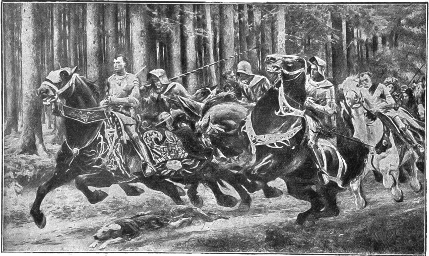
Die Schlacht Karls des Kühnen. Gemälde von Eugène Burnand. Gott- fried-Keller-Stiftung, Museum Lausanne.