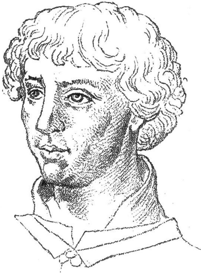
Karl der Kühne von Burgund. Zeitgenössische Zeichnung. Museum Arras.

beschlagen und mit Eisenzaden versehen waren. Die Menge der übrigen Waffen, wie Picken, Schwerter, Armbruste, Streitärte usw., war unermesslich. Unter anderm fand man auch ein Faß voll Stricke mit zulaufenden Schlingen, wahrscheinlich zu demselben Gebrauche bestimmt, den der Herzog bei der Besatzung von Grandson damit machte; andere Fässer enthielten Pfeile aus englischer Fabrik, ein Teil davon war vergiftet.