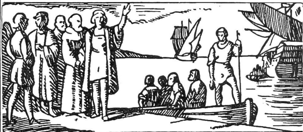
Kolumbus verläßt Spanien zu seiner ersten Entdeckungsreise.

1481 Stanser Verkommnis, Niklaus von der Flüe als Friedensstifter. Freiburg u. Solothurn werden in den eidgenössisch. Bund aufgenommen.