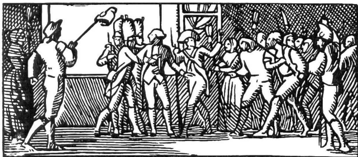
Fransösisches Volk setzt Ludwig XVI. die Freiheitsmütze auf.