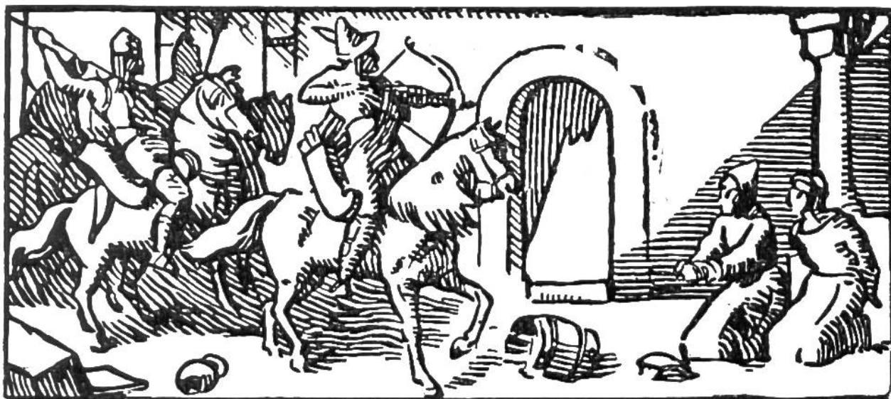
Die Hunnen im Kloster St. Gallen.