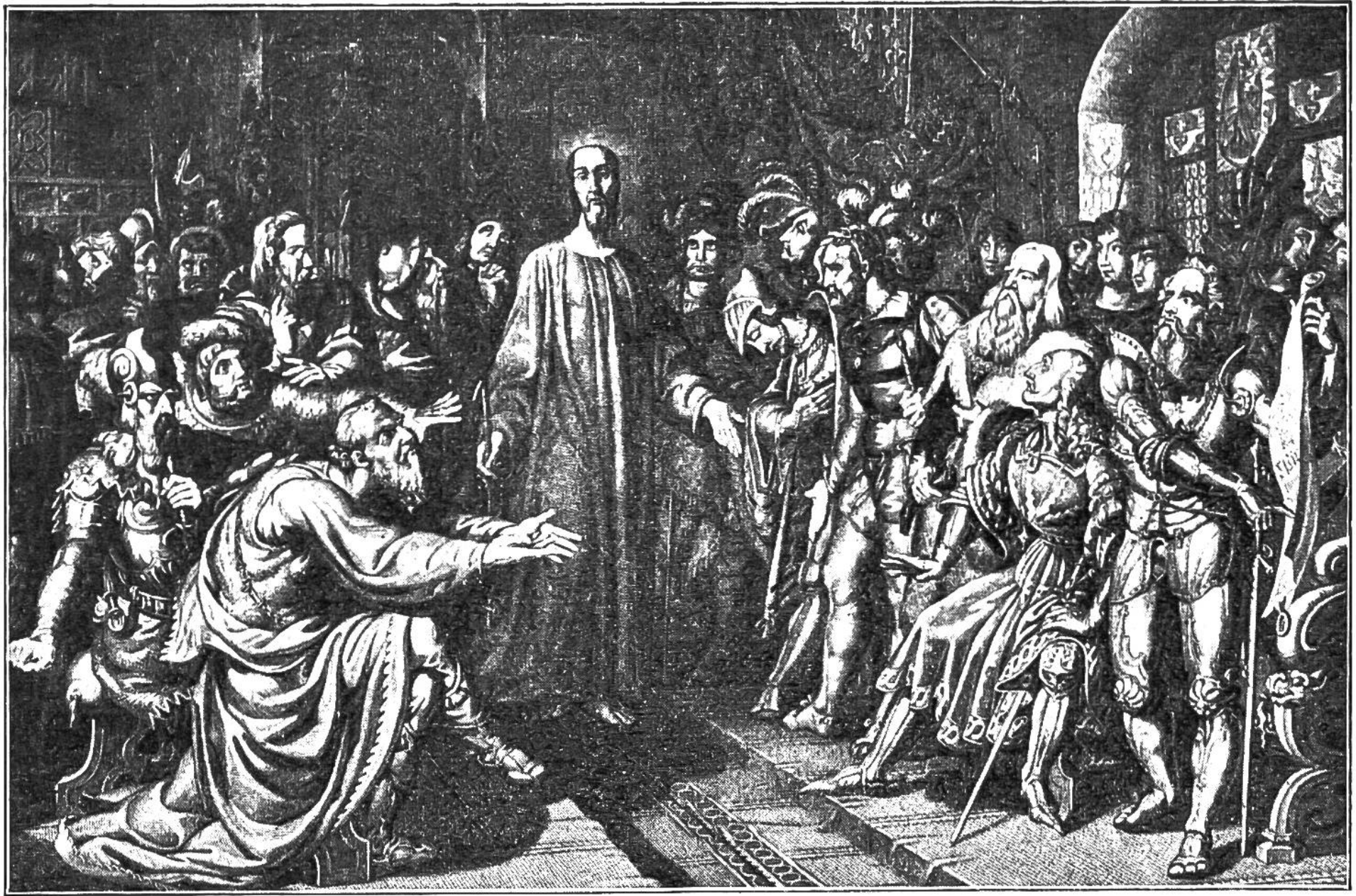
Niklaus von der Flüe schlichtet den Streit der Eidgenossen auf der Tagsatzung zu Stans. 1481. (Nach Vogel.)