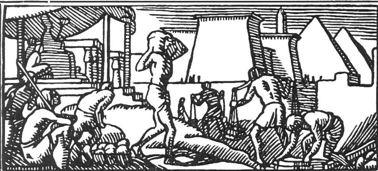
Ägypter beim Pyramidenbau.