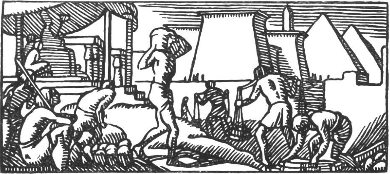
Ägypter beim Pyramidenbau.