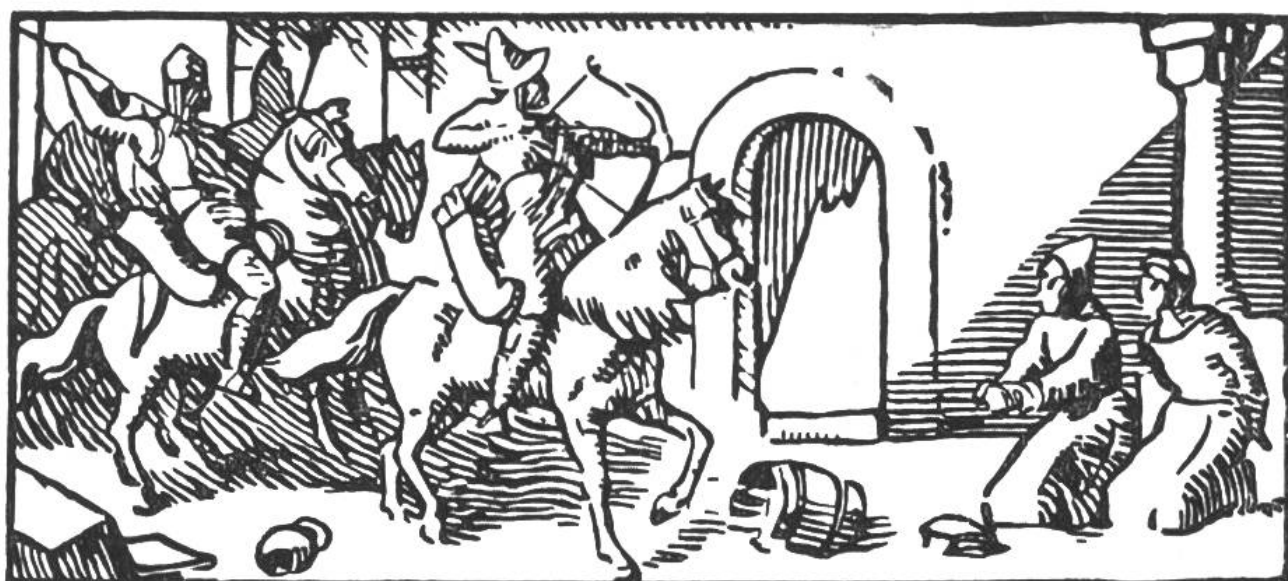
Die Hunnen im Kloster St. Gallen.