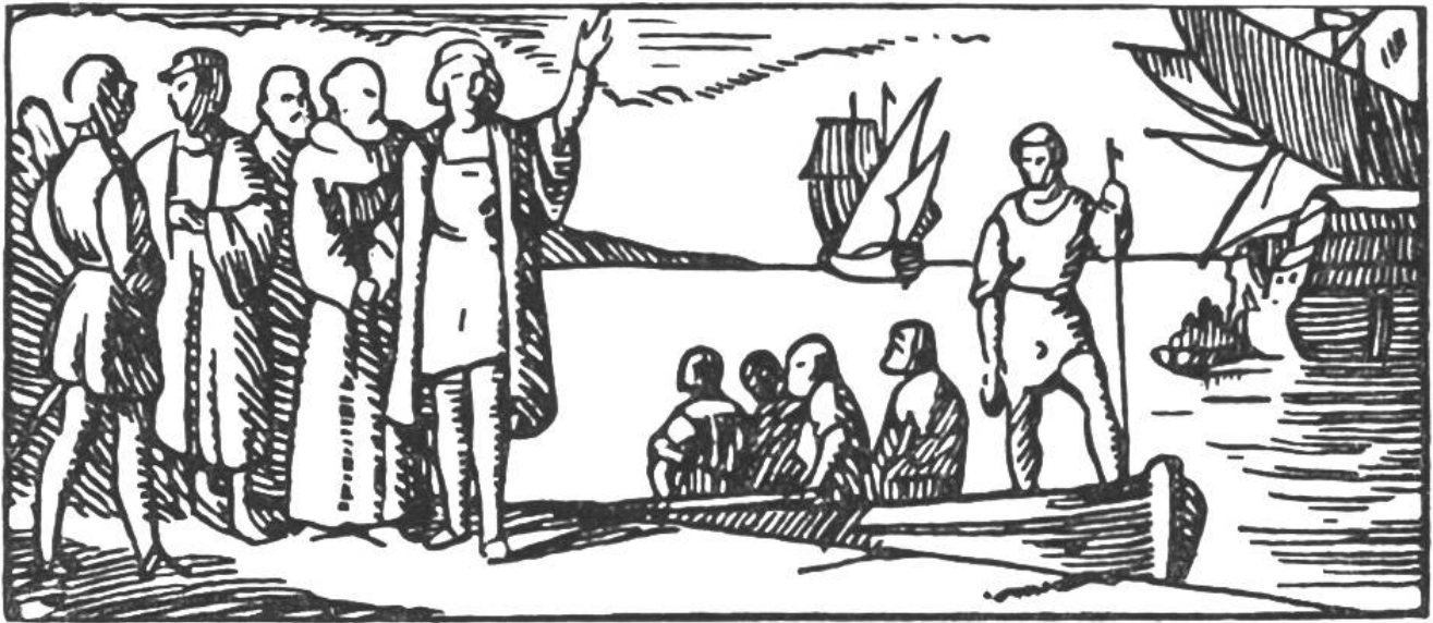
Kolumbus verlässt Spanien zu seiner ersten Entdeckungsreise.

1481 Stanser Verkommnis, Niklaus von der Flüe als Friedensstifter. Frei- burg und Solothurn werden in den eidgenössischen Bund auf- genommen.