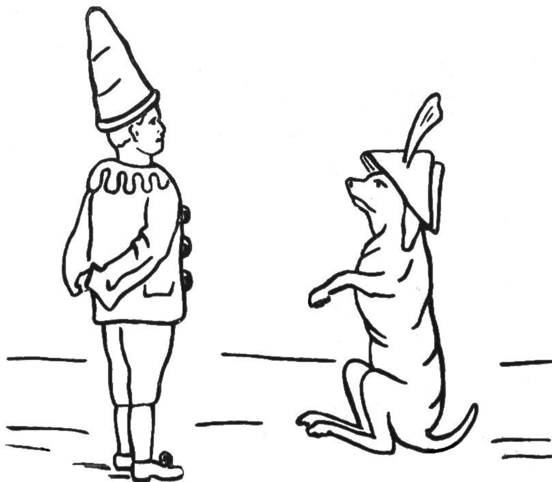
Zeichnung zu einer Stilstich-Stickerei auf der Tasche des Spielhöschens.

von der linken auf die rechte Seite überstürzt. Dazu könnt ihr den gleichen oder einen Garniturstoff verwenden. Den vordern Halsausschnitt zieht ihr auf 12 Zentimeter ein; dann wird der Halsausschnitt in gleicher Weise besetzt wie Ärmel und Beinchen. Bei Verwendung des Höschenstoffes zum Besatz kann zur Verzierung ein schmales, andersfarbiges Liseré eingenäht werden. Vorn auf dem Höschen wird die Tasche aufgesteppt, deren oberer Rand, der übrigen Garnitur entsprechend, abgeschlossen wird. Ausserdem kann die Tasche mit einer kleinen Stil- oder Kreuzstichstickerei verziert werden. In der Rückenmitte wird das Spielhöschen mit Druckknöpfen geschlossen.