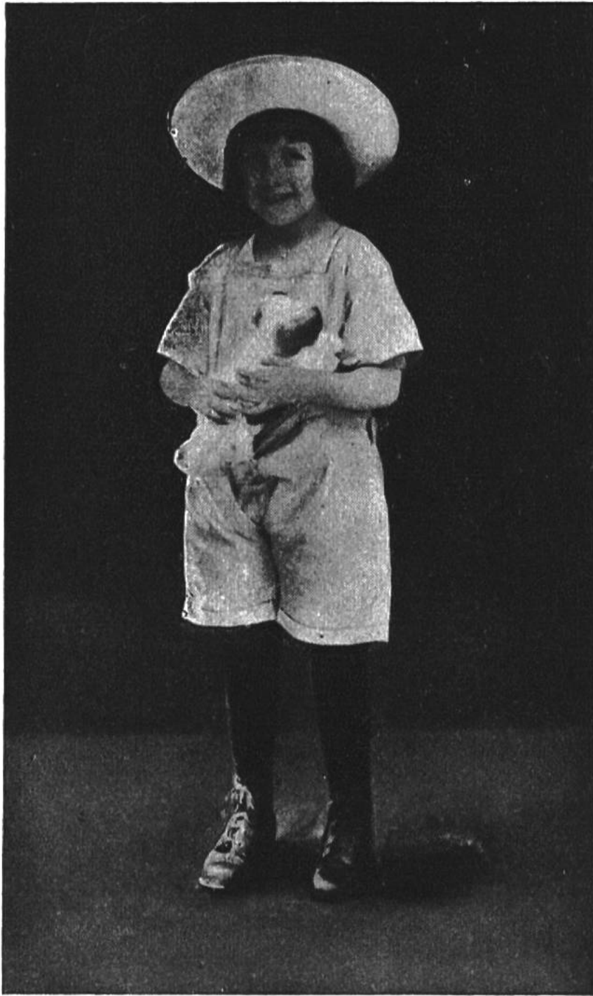
Bubi in Spielhöschen.