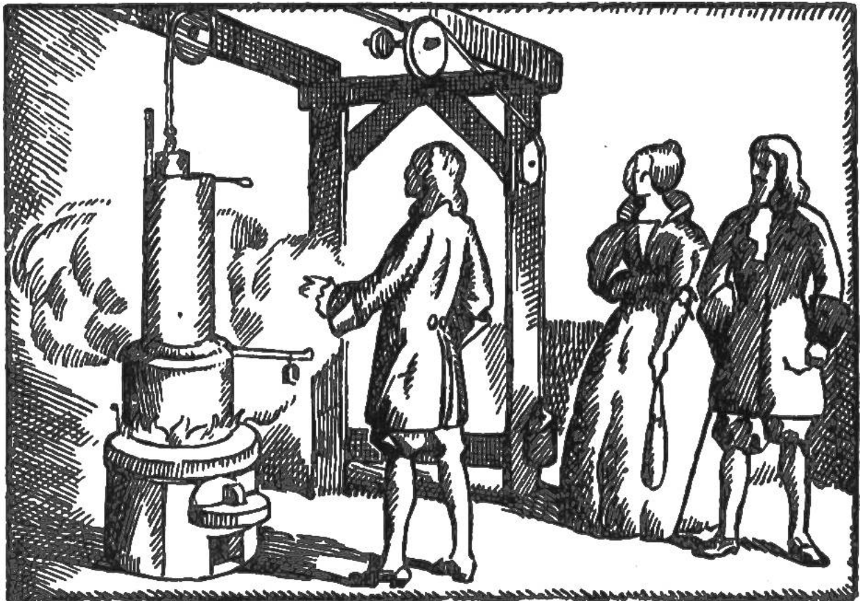
1690 Papin baut eine Dampfmaschine und verwendet das Feuer zur Kräftezeugung.

Ausgangspunkt war die Eroberung des Feuers. Das Feuer schuf uns Töpferei, Glas, Metalle, Porzellan und ermöglichte die meisten heutigen Gewerbe. Das Feuer machte den Menschen vom Klima unabhängig, setzte die Völker instand, sich über die Erde zu verbreiten und sogar den Schrecken einer Eiszeit Trotz zu bieten. Wie das Feuer als Wärmespender die menschlichen Lebensbedingungen verändert hatte, veränderte es sie von neuem durch seine direkte Verwendung bei technischen Arbeiten.