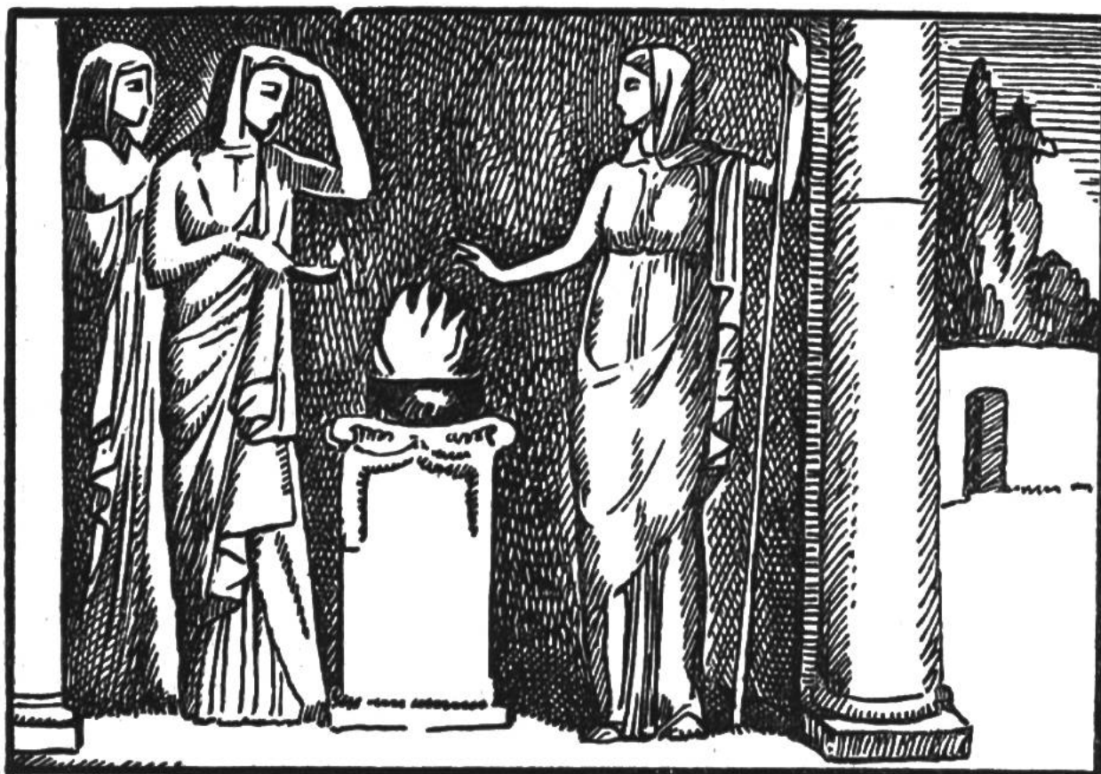
Vestalinnen bewachen das heilige Feuer.

sprühte Funken, besonders wenn es im Dunkel der Höhle mit einem eisenhaltigen Stein bearbeitet wurde. Der Mensch nannte es deshalb Feuerstein. Er lernte auch, diese Funken auffangen und beleben. Nun lag es in seiner Macht, Flammen zu entfachen, und damit begann er, Herr über das Feuer zu werden.