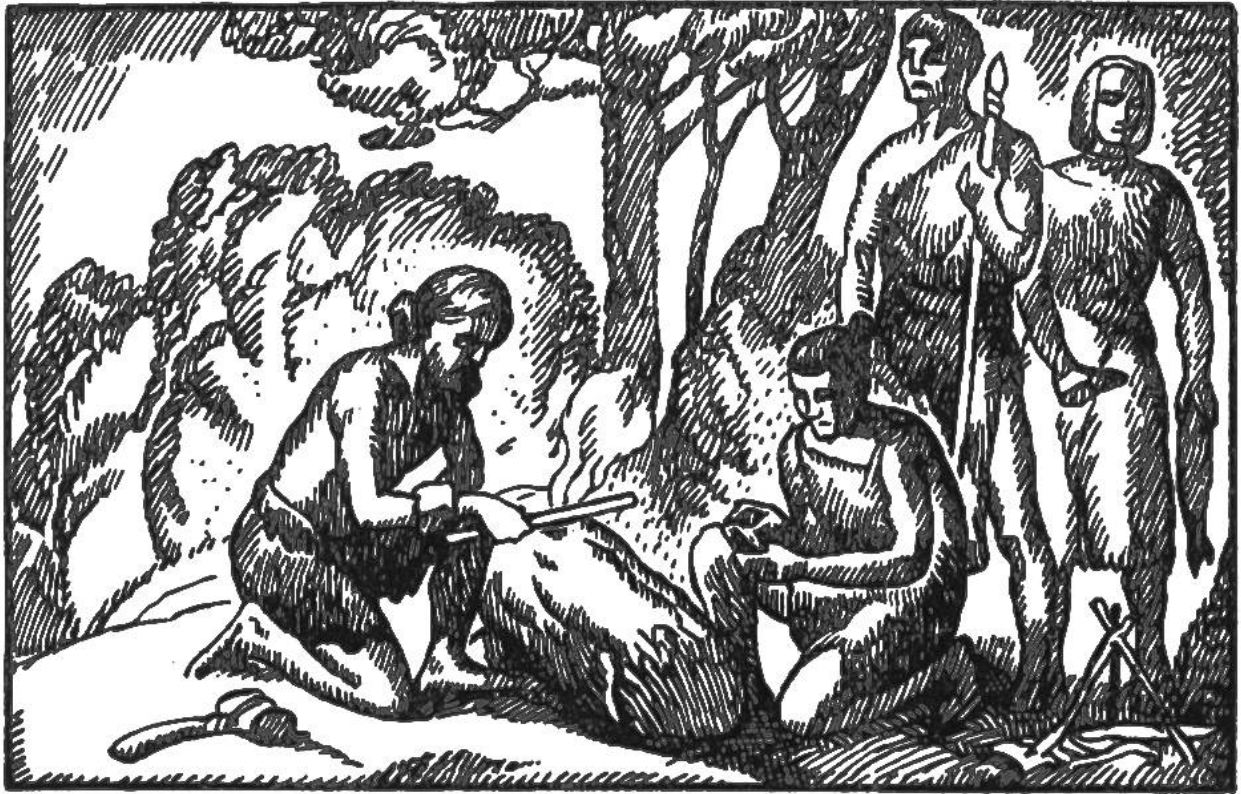
Die Menschen erlernen Feuer zu erzeugen.

Aber noch bestand die grosse Gefahr, dass das Feuer in der Regen- oder Winterszeit erlösche. Da machte ein Mensch die Entdeckung, dass sich die Flamme beliebig herbeschwören liess. Wurden zwei trockene Holzstäbe, ein harter und ein weicher, rasch und geschickt aneinander gerieben, so erschien plötzlich das himmlische Wesen; die Holzstäubchen entzündeten sich und die Funken konnten in dürrerem Gras oder Laub aufgefangen und entfacht werden. Ehrerbietig wurde dem eben von Gott kommenden Boten Fett zum Empfange gereicht, damit er befriedigt und guter Laune sei, und bald loderte das Feuer helleuchtend auf. An die emporsteigenden Flammen und den zum Himmel strebenden Rauch richtete der Mensch seine Gebete, mit der Bitte, sie den Göttern zu überbringen.