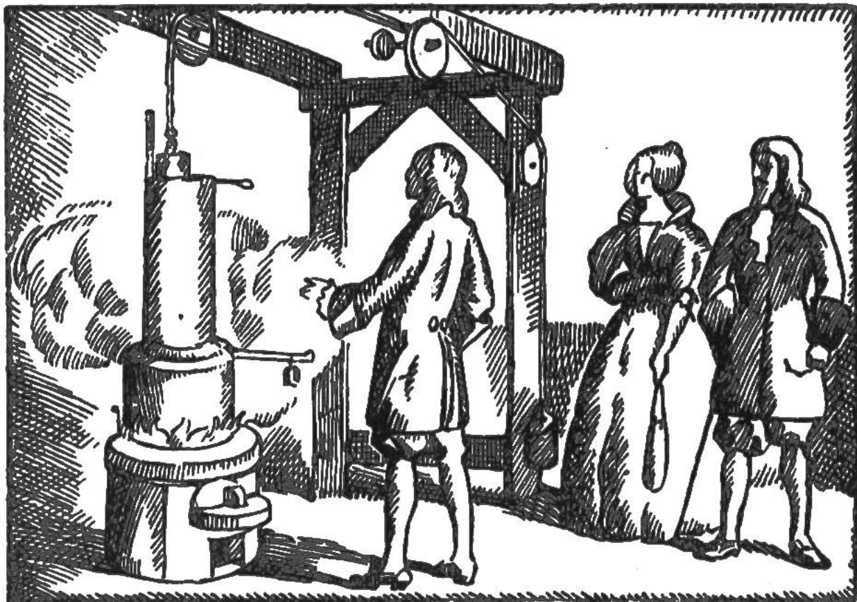
1690 Papin baut eine Dampfmaschine und verwendet das Feuer zur Krafterzeugung.

Ausgangspunkt war die Eroberung des Feuers. Das Feuer schuf uns Töpferei, Glas, Metalle, Porzellan und ermöglichte die meisten heutigen Gewerbe. Das Feuer machte den Menschen vom Klima unabhängig, setzte die Völker instand, sich über die Erde zu verbreiten und sogar den Schrecken einer Eiszeit Trotz zu bieten. Wie das Feuer als Wärmespender die menschlichen Lebensbedingungen verändert hatte, veränderte es sie von neuem durch seine direkte Verwendung bei technischen Arbeiten.