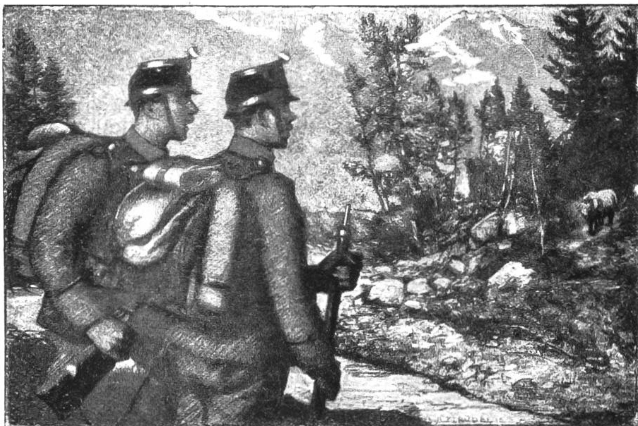
Schweizersoldaten sehen einen Bären am Spöl im Nationalpark.