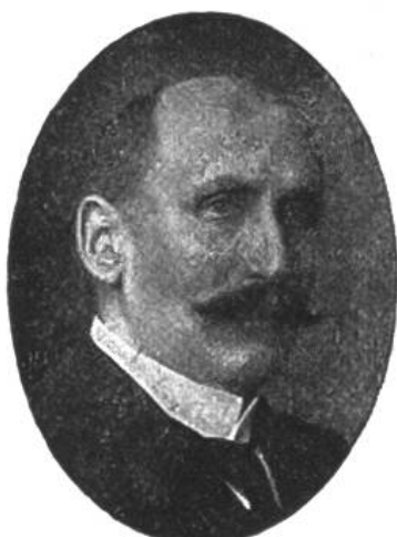
Dr. Felix Calonder von Trins, Grbd. geb. 1863, seit 1913 i. Amte.