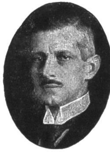
Dr. Robert Haab von Wädenswil geb. 1865, seit 1918 i. Amte.