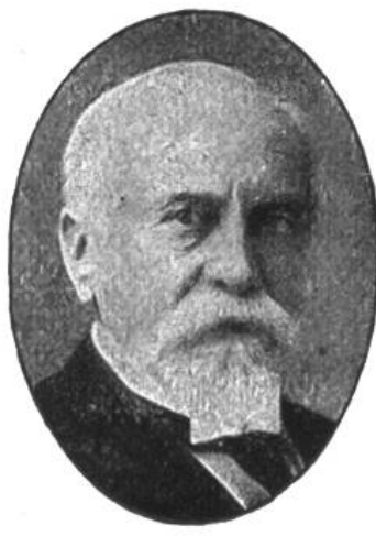
Gustave Ador von Genf geb. 1845, seit 1917 i. Amte.