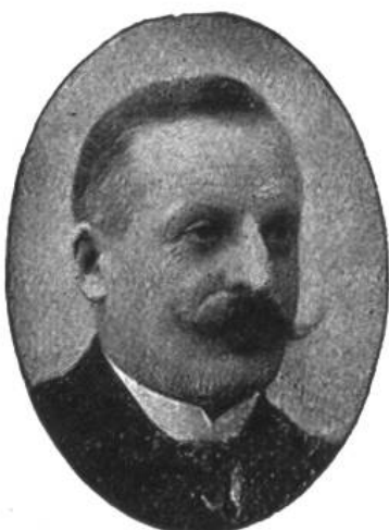
Dr. Giuseppe Motta von Airolo geb. 1871, seit 1912 i. Amte.