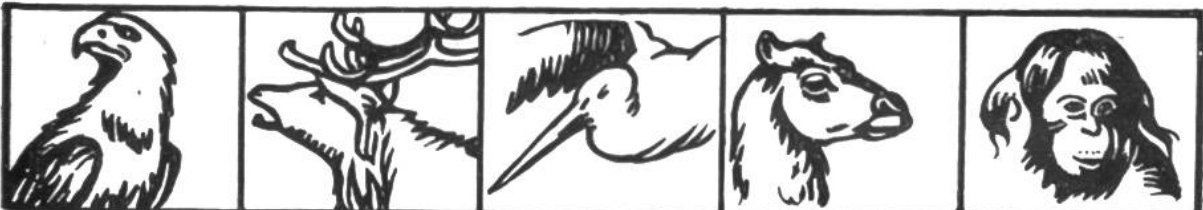
Adler, Hirsch, Storch, Kamel, Orang-Utan, 30 Jahre. 35—40 Jahre. 35—40 Jahre. 35—40 Jahre. 40 Jahre.