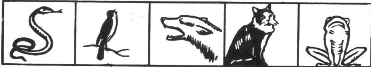
Viper, Nachtigall, Wolf, Katze, Frosch, 10 Jahre. 12 Jahre. 10—15 Jahre. 15 Jahre. 15 Jahre.