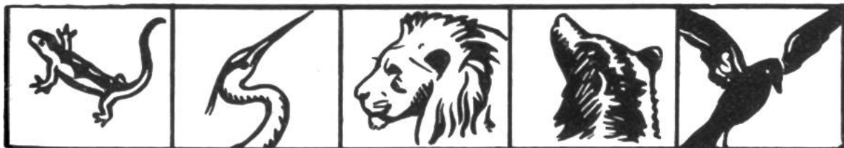
Salamander, Reiher, Löwe, Bär, Rabe, 40 Jahre. 50 Jahre. 50 Jahre. 50 Jahre. 80 Jahre.