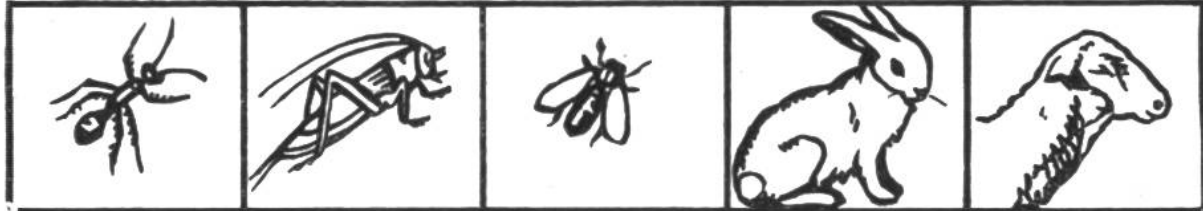
Ameise, Heimchen, Bienenkönigin, Hase, Schaf, 1 Jahr. 1 Jahr. 1 Jahr. 6—10 Jahre. 8—10 Jahre.