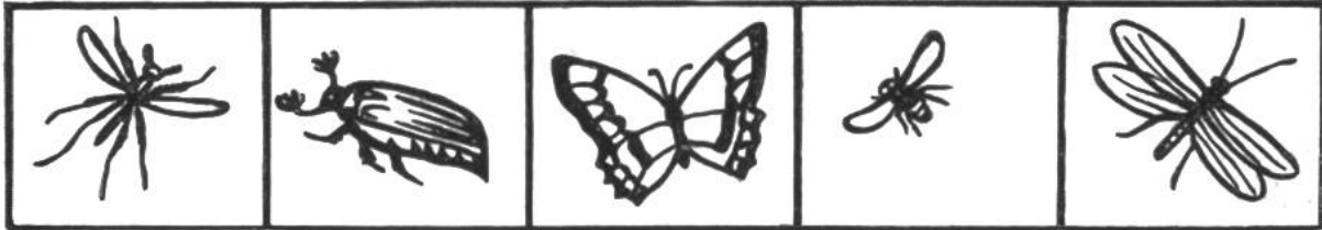
Eintagsfliege, Maikäfer, Schmetterling, Fliege, Mücke, 1 Jahr. 6 Wochen. 2 Monate. 3—4 Monate. 6 Monate.