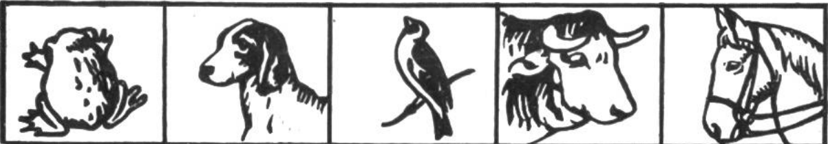
Kröte, Hund, Distelfink, Ochse, Pferd, 20 Jahre. 15—25 Jahre. 18 Jahre. 25 Jahre. 25—30 Jahre.