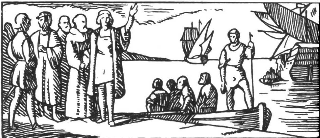
Kolumbus verlässt Spanien zu seiner ersten Entdeckungsreise.