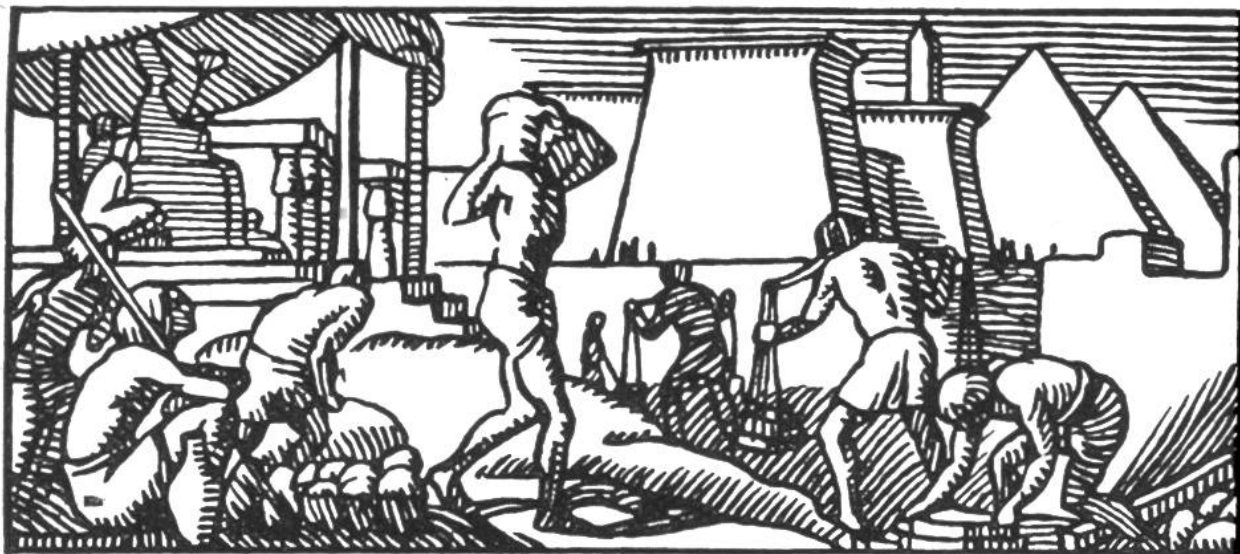
Ägypter beim Pyramidenbau.