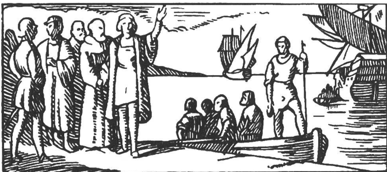
Kolumbus verlässt Spanien zu seiner ersten Entdeckungsreise.