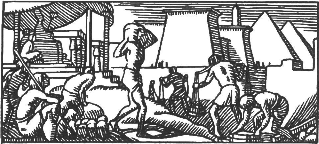
Ägypter beim Pyramidenbau.