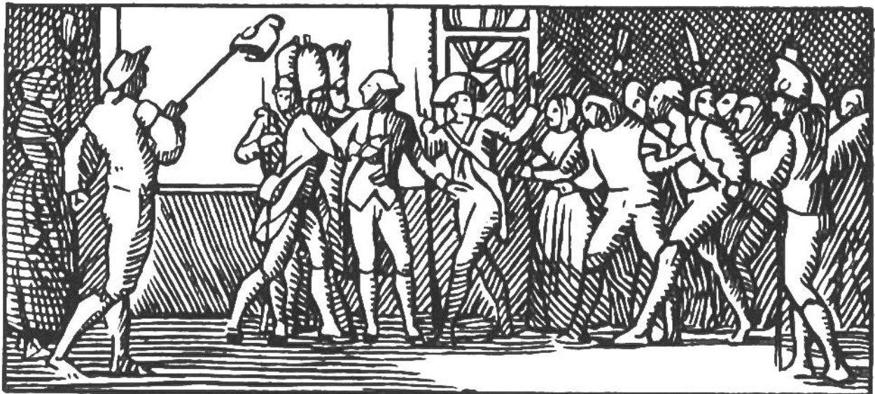
Französisches Volk setzt Ludwig XVI. die Freiheitsmütze auf.