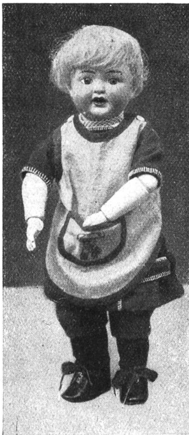
Buby mit Spielschürzchen.

wird die Bande zusammengenäht und beidseitig eingebogen; oben macht ihr den gleichen Zierstich wie beim Russenkittel, heftet dann den Rand leicht auf den Boden des Mützchens und unten näht ihr das Futter sauber dagegen.