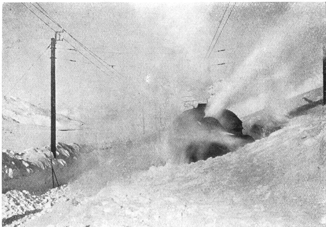
Schneesleudermaschine an der Arbeit.

Im Winter setzen die gewaltigen Schneemassen, die das Geleise versperren, unsern Bergbahnen fast unüberwindliche Hindernisse entgegen. Viele Bahngesellschaften sind gezwungen, fast während des ganzen Winters den Verkehr einzustellen.