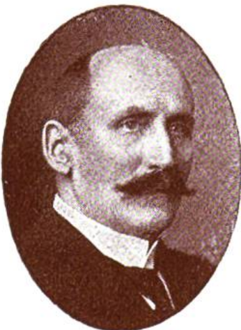
Dr. Felix Calonder von Trins, Grbd. geb. 1863, seit 1913 i. Amte.