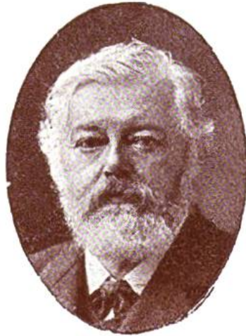
Dr. Ludwig Forrer v. Bärenswil u. Winterthur geb. 1845, seit 1903 i. Amte.