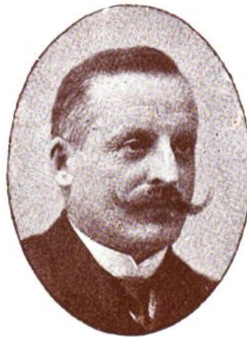
Dr. Giuseppe Motta von Airolo geb. 1871, seit 1912 i. Amte.