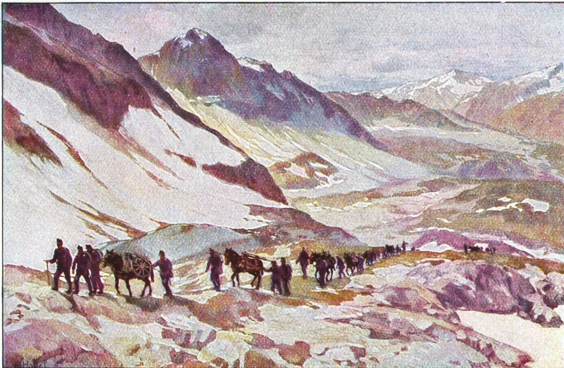
SAUMKOLONNE IM GOTTHARDGEBIET.

Für die Leser des Pestalozzikalenders gemalt von E. Hodel, Luzern.