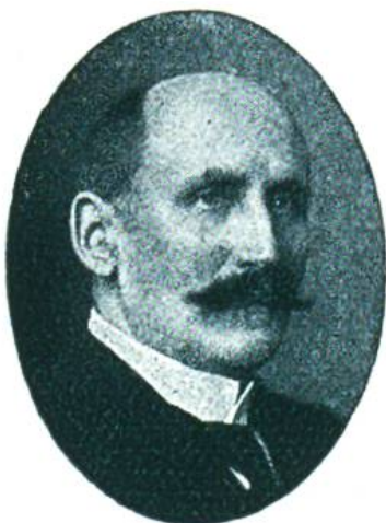
Dr. Felix Calonder von Trins, Grbd. geb. 1863, seit 1913 i. Amte.