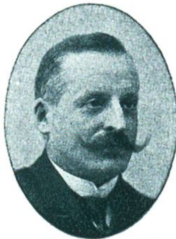
Dr. Giuseppe Motta von Airolo geb. 1871, seit 1912 i. Amte.