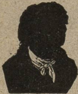
Nr. 1 ?