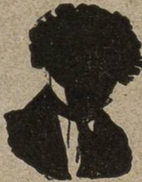
Nr. 3 ?