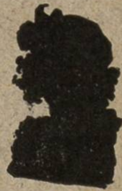
Nr. 4 ?