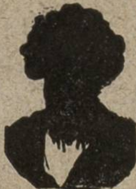
Nr. 2 ?