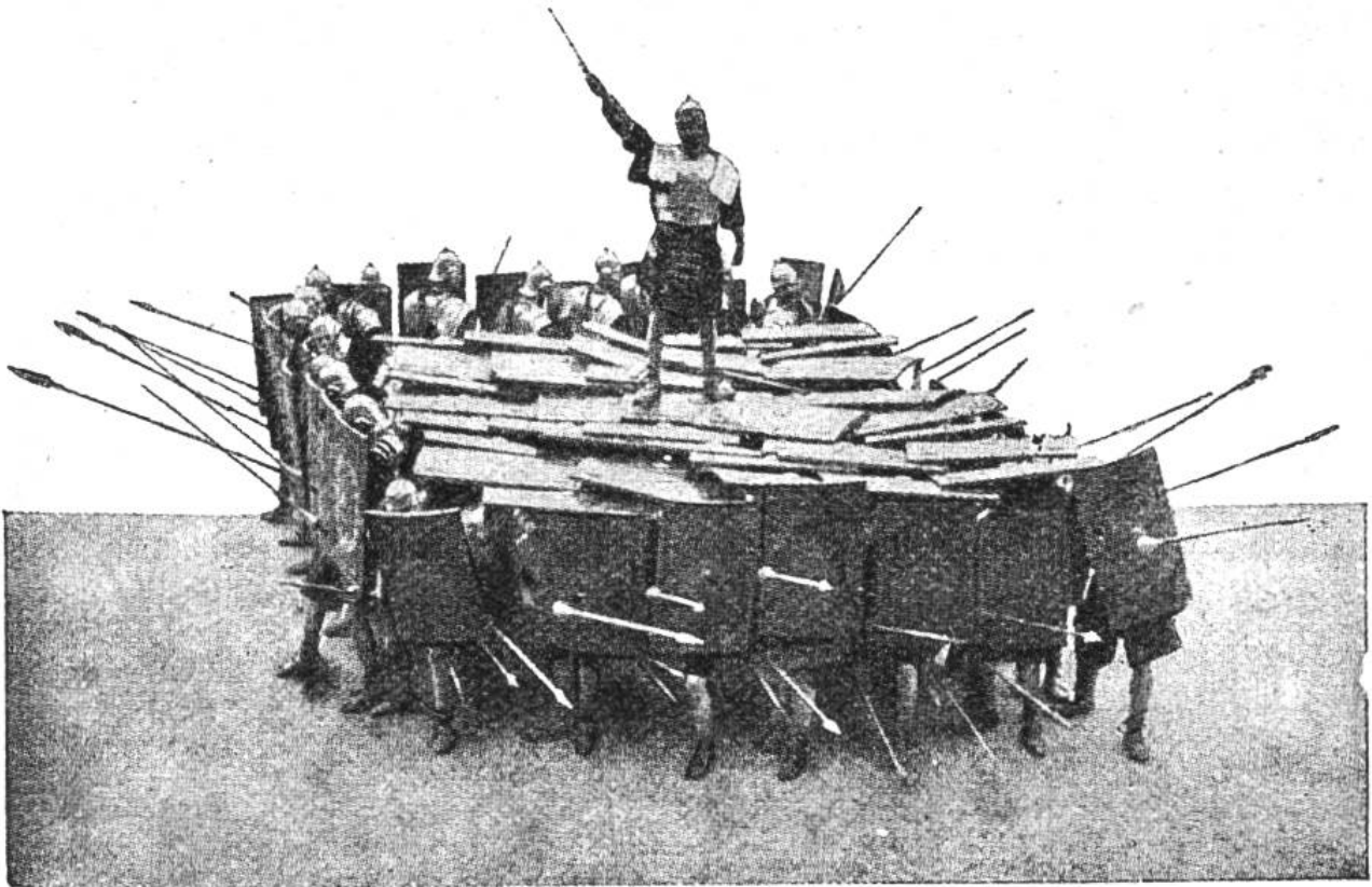
Römische Soldaten in Schlachtordnung.