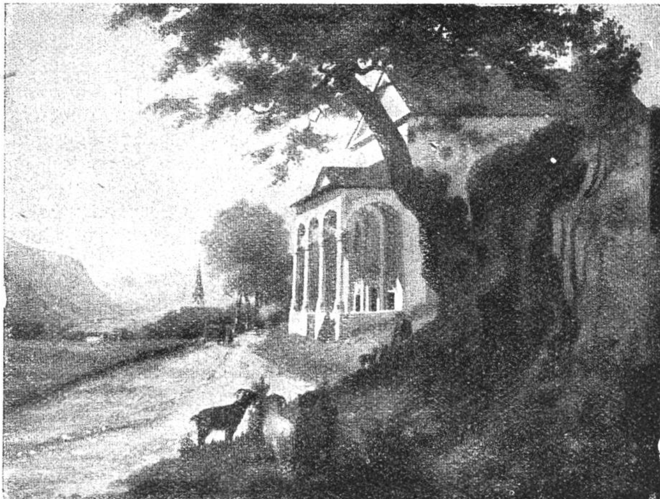
Der alte Ahorn von Truns,

unter dem der Bundesschwur des Grauen Bundes am 16. März 1424 stattfand.