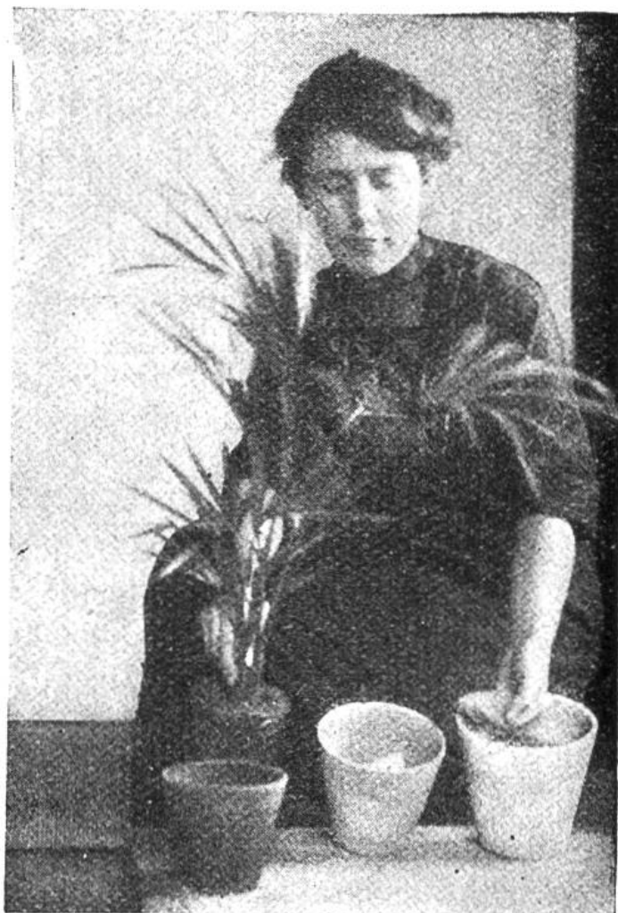
Der neue Topf erhält eine Bodenlage von kleinen Scherben und Sand.

Unsere Zimmerpflanzen, die in den engen Töpfen nur wenig Raum zur Entwicklung haben, müssen, dem Wachstum der einzelnen Arten entsprechend, von Zeit zu Zeit versetzt werden. Durch leichtes Aufklopfen des Topfrandes an eine Tischkante hebt man die Pflanze aus ihrem Topf (siehe Abbildung); hat sie rings um den Ballen nichts als Wurzeln, so ist es Zeit, ihr einen grösseren Topf zu geben. Bevor man zum Verpflanzen schreitet verschaffe man sich die nötigen