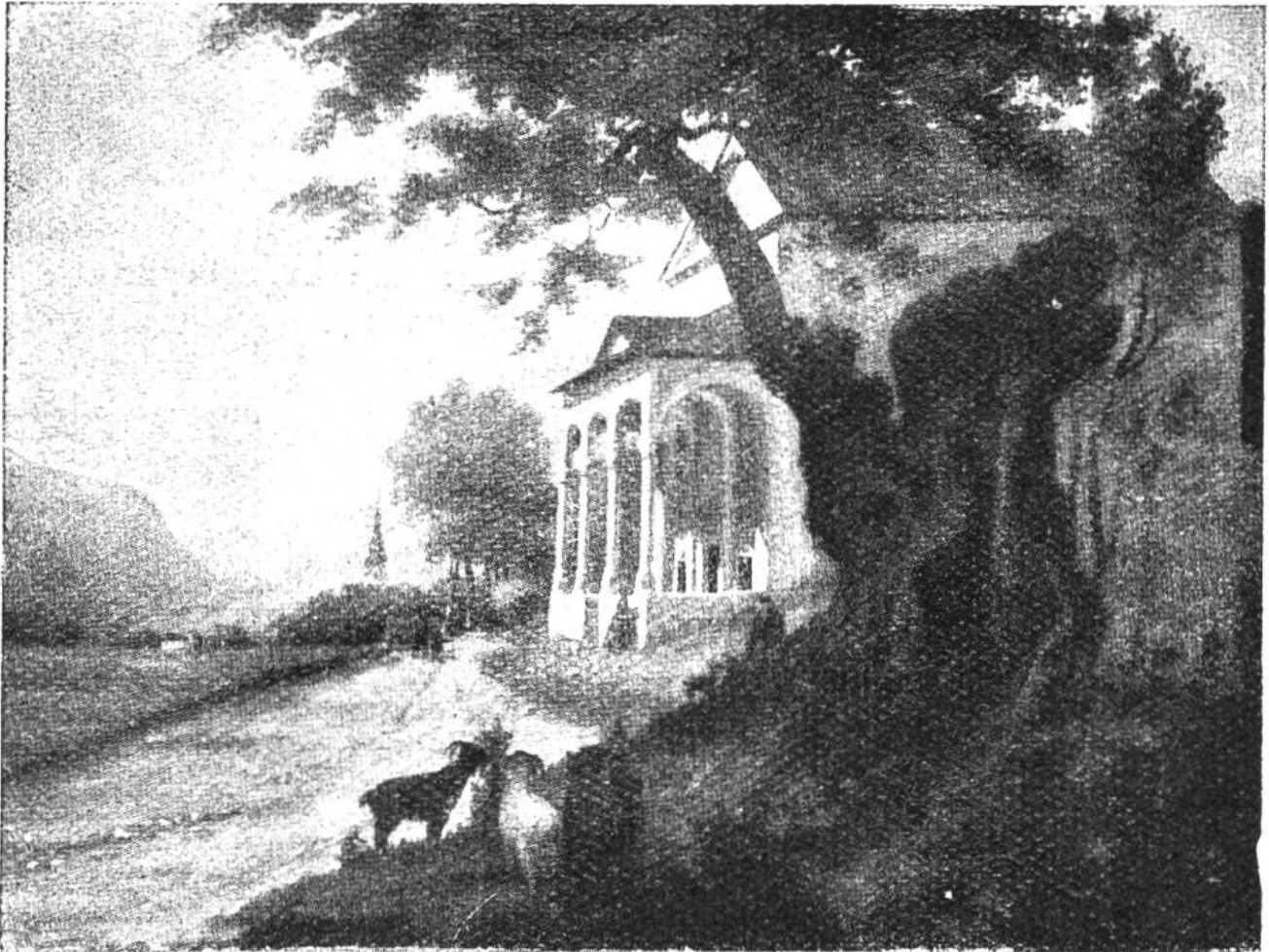
Der alte Ahorn von Truns,

unter dem der Bundesschwur des Grauen Bundes am 16. März 1424 stattfand.