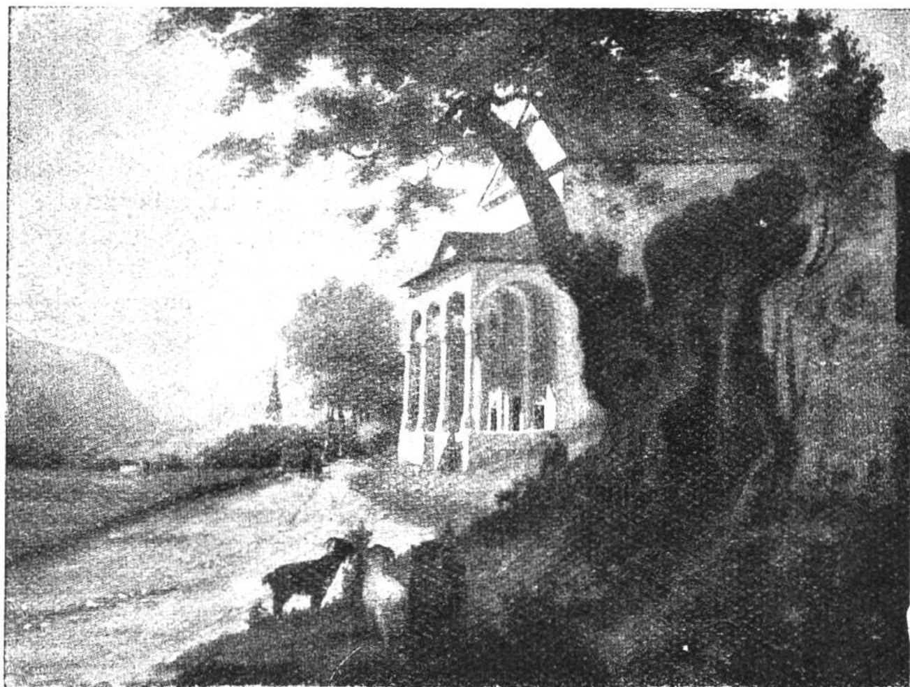
Der alte Ahorn von Truns,

unter dem der Bundesschwur des Grauen Bundes am 16. März 1424 stattfand.