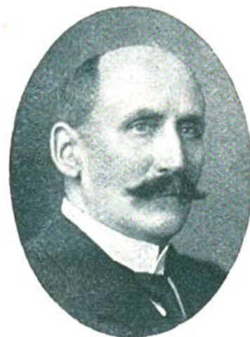
Dr. Felix Calonder von Trins, Grbd. geb. 1863, seit 1913 i. Amte.