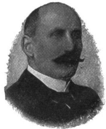
Dr. Felix Calonder (Graubünden) geb. 1863, seit 1913 i. Amte.