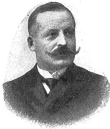
Dr. Giuseppe Motta (Tessin) geb. 1871, seit 1912 i. Amte.