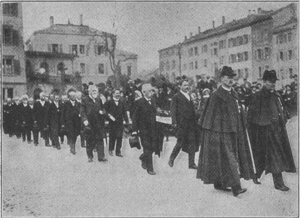
Die Regierungsmitglieder schreiten durch die Menge zum Ring.