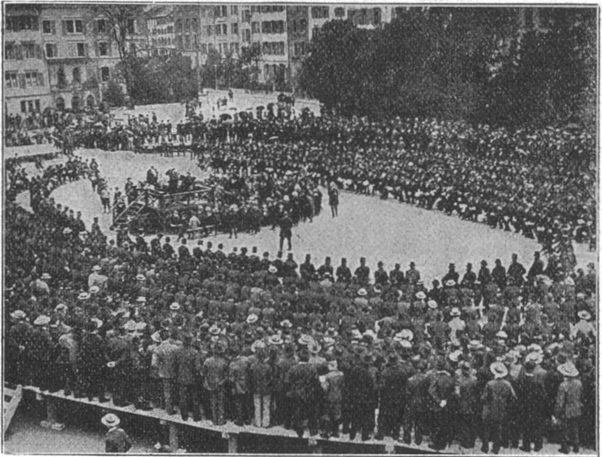
Blick auf die Landsgemeinde.

Beim Podium des Präsidenten sind die Schulknaben, die durch Teilnahme an der Versammlung Interesse für die staatlichen Angelegenheiten erhalten sollen.