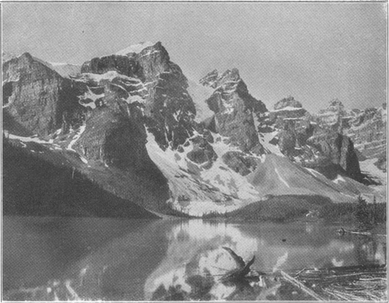
Felsengebirge in Britisch Columbien.