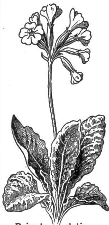
Primula elatior Hohe Schlüsselblume

Wertvolle, schöne Preise für die besten Sammlungen (s. Seite 9).