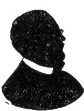
Nr. 1 ?