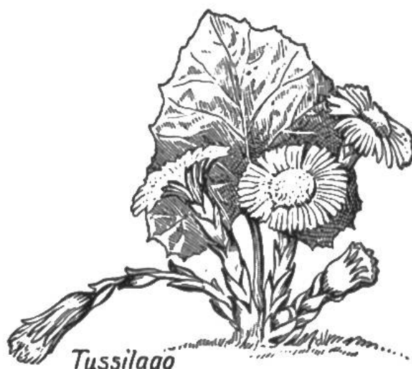
Tussilago farfara Gemeiner Huflattich

Die fünf zu suchenden Pflanzen. (Siehe auch Aufgabe S. 199.)