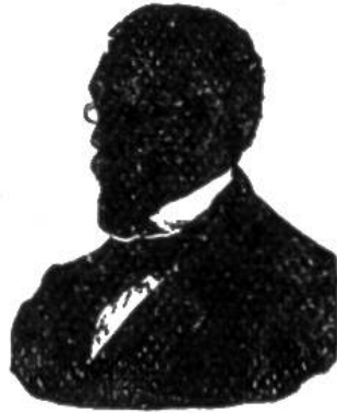
Nr. 2 ?