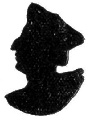
Nr. 4 ?

Wer diese Aufgabe lösen will, tut gut, die Bilder im Pestalozzikalender genau zu betrachten, es wird ihn dies am schnellsten auf die richtige Spur führen.