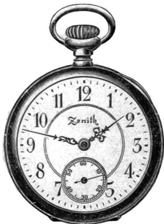
Silb. Damen-Präz.-Uhr, Orig.-Gr., Marke Zenith, Ladenpreis Fr. 47.—

für die Teilnehmer an den Pestalozzi- Wettbewerben.