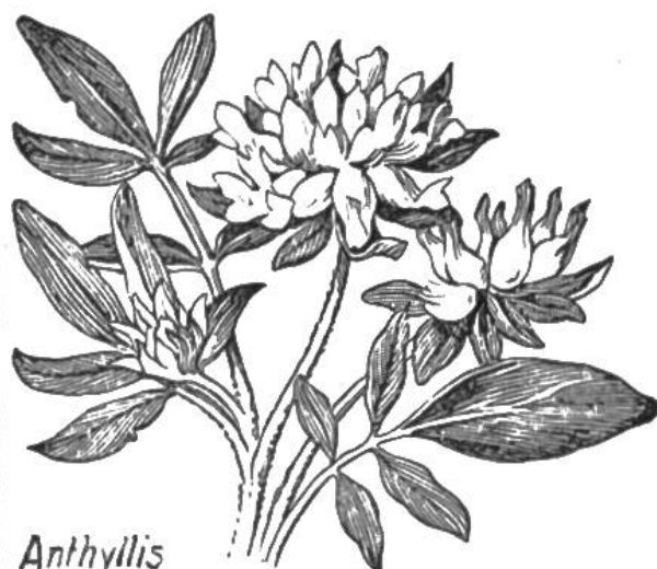
Anthyllis vulneraria Echter Wundklee