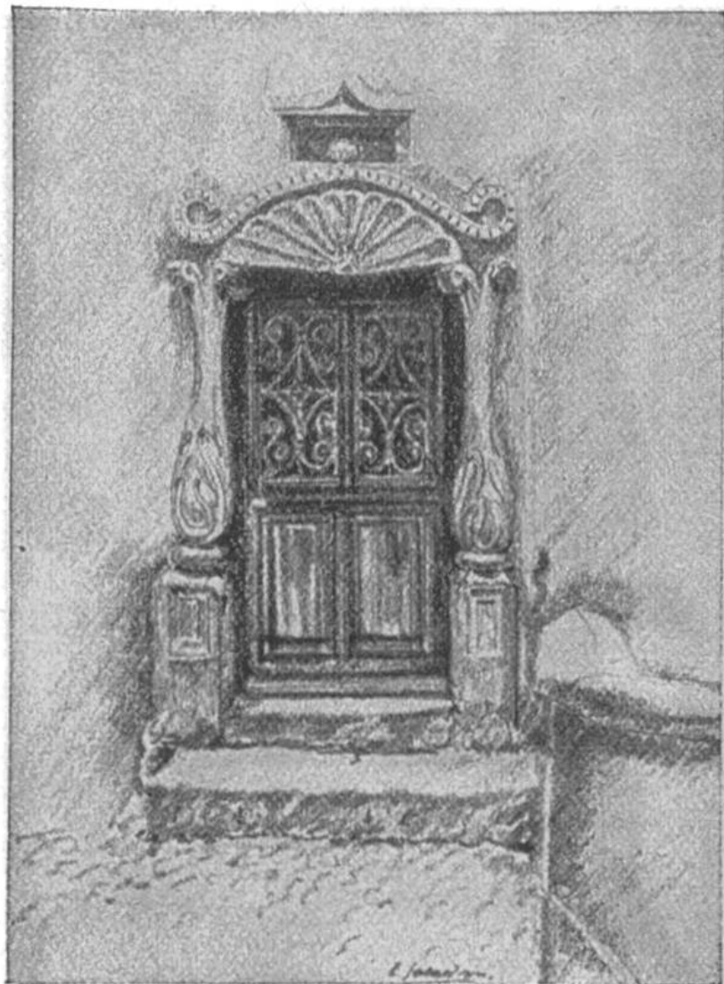
Hauseingang, gezeichnet von E. Saladin, Biel, 16 Jahre alt.

Jeder Besitzer eines Pestalozzikalenders, Jahrgang 1913, kann an dem Wettbewerb teilnehmen. Die Einsender der besten Arbeiten erhalten Preise. Die schönsten Bilder sind zu Ausstellungszwecken bestimmt. Sämtliche eingelangten Arbeiten bleiben Eigentum der Herausgeber des Kalenders. Die Bewerber sind gebeten, sich genau an die nachstehenden Vorschriften zu halten.