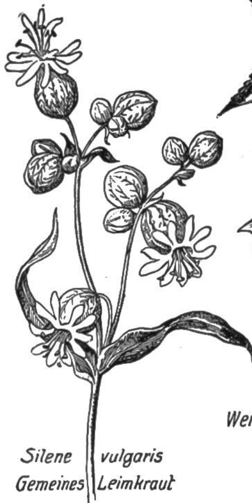
Silene vulgaris Gemeines Leimkraut