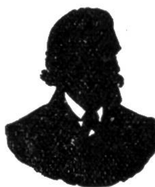
Nr. 3 ?