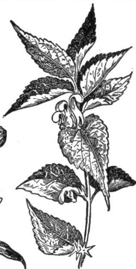
Lamium album Weisse Taubnessel