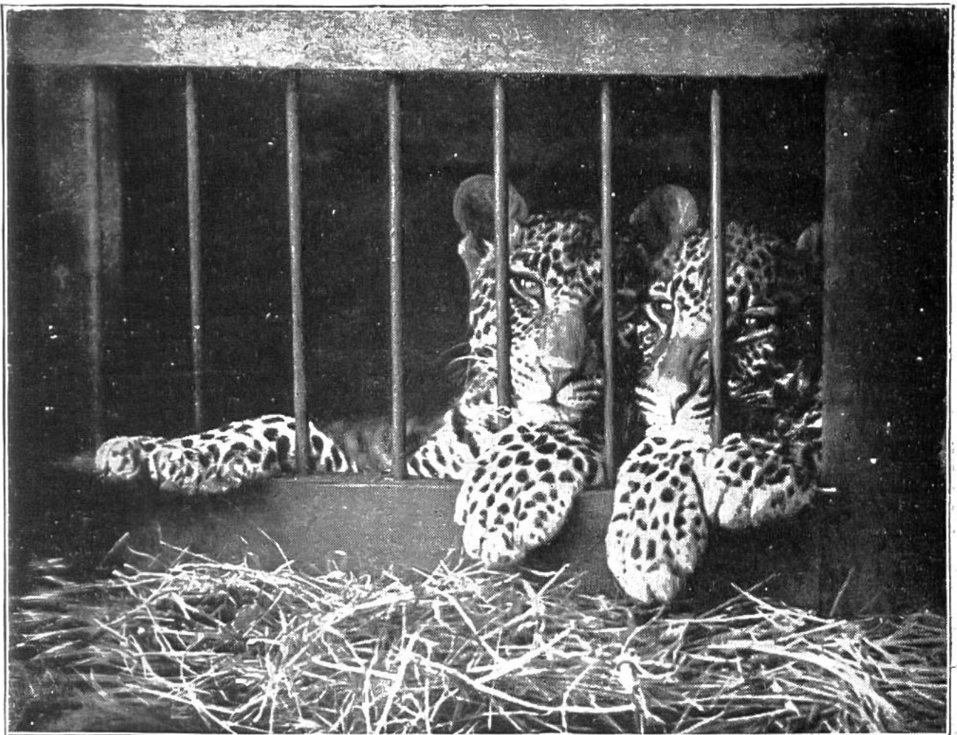
Die beiden Geschwister. Phot. Aufnahme nach Natur.

Letztes Frühjahr wurden versuchsweise 5 Exemplare Steinwild aus dem Wildpark in St. Gallen durch die Regierung angekauft und im Rappenloch (1691 m) ob Weisstannen ausgesetzt, wo sich die Tiere bald heimisch fühlten. Im Laufe des Sommers vermehrte sich die Kolonie um ein hübsches Zicklein. Die Herde hat sich in die ungangbaren Bänder des Marchsteins zurückgezogen und kommt nur zur Ätzung in das Gelände der Valtnovalp hinunter im Verein mit den im Banngebiet zahlreich vorkommenden Gemsen. Es ist zu wünschen, dass der Versuch, unser Alpengebiet mit diesem Wilde neu zu bevölkern, von Erfolg begleitet sein wird. Es würden dann wohl auch in andern Gegenden des Schweizerlandes weitere Kolonien eingesetzt. Bis jetzt kam das Steinwild in Europa nur noch im Bereiche des Gran Paradiso, dem Jagdgebiete des Königs von Italien, freilebend vor.