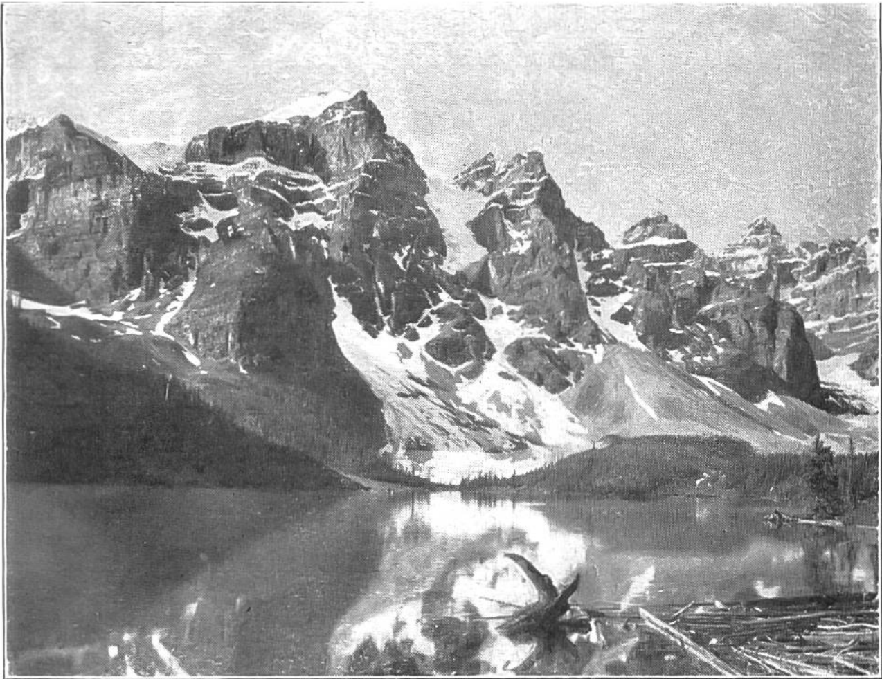
Felsengebirge in Britisch Columbien.