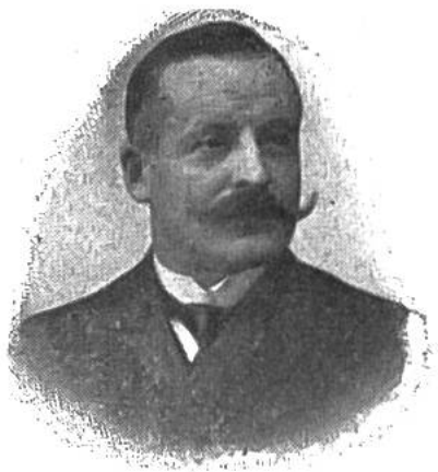
Dr. Giuseppe Motta (Tessin) geb. 1871, seit 1912 i. Amte.