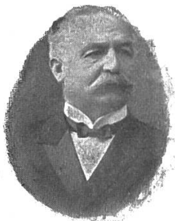
Dr. Eduard Müller (Bern) geb. 1848, seit 1895 i. Amte