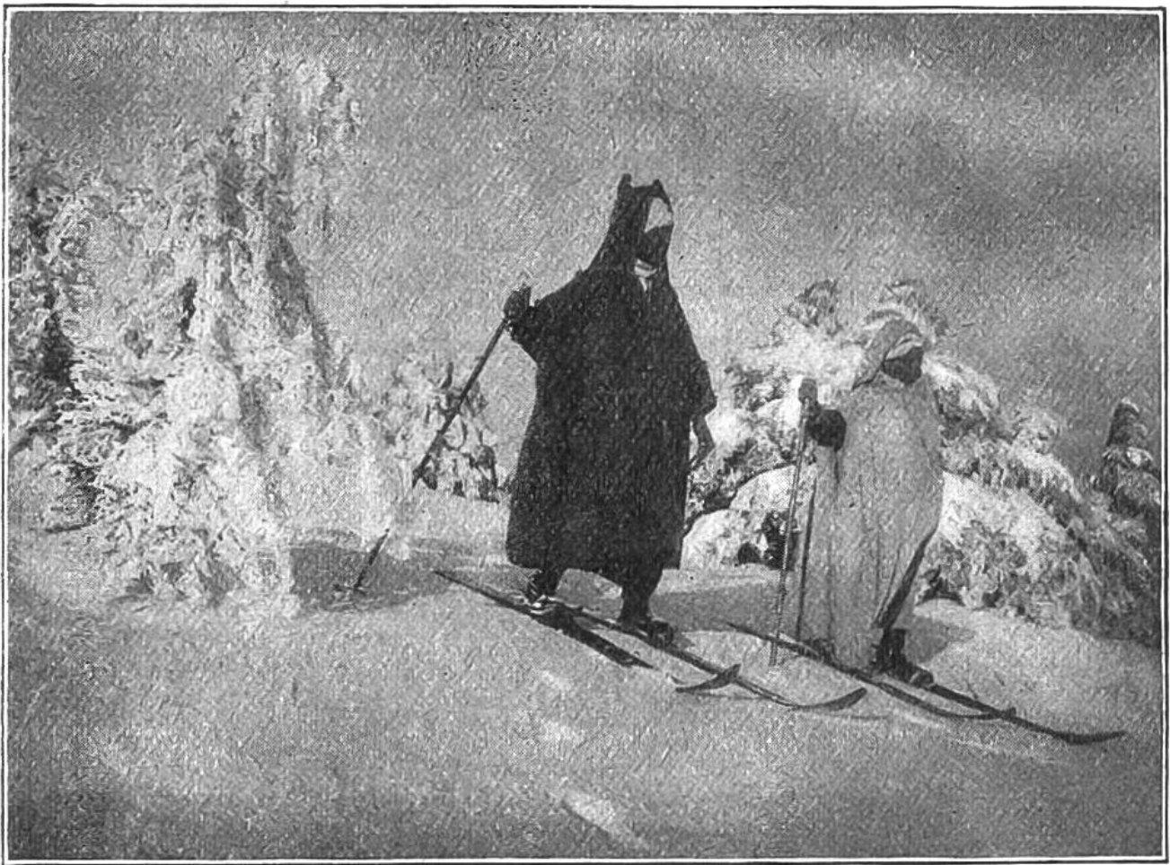
Arabische Teilnehmer an einem Skiwettfahren in Algier