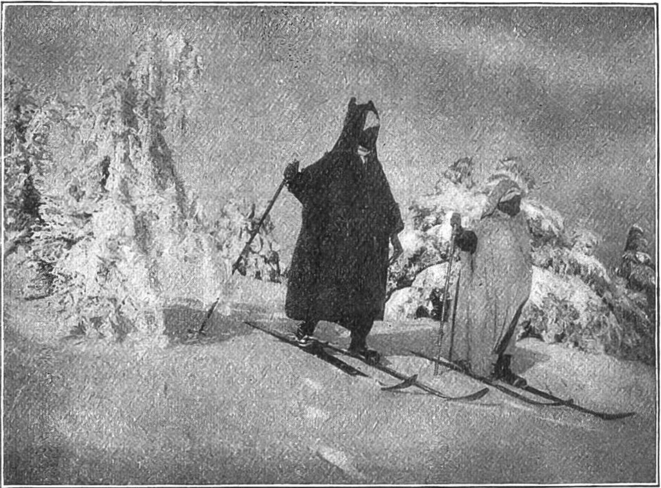
Arabische Teilnehmer an einem Skiwettfahren in Algier