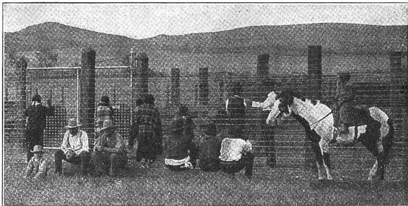
Vor der Umzäunung des Büffelparkes.

nur noch 2047 rassenreine Büffel auf der Erde leben, wovon 325 wild und 1722 in Gefangenschaft. Von den wilden leben 25 in den Vereinigten Staaten, 300 in Kanada, von den gefangenen 1116 in den Vereinigten Staaten, 476 in Kanada und 130 in Europa.