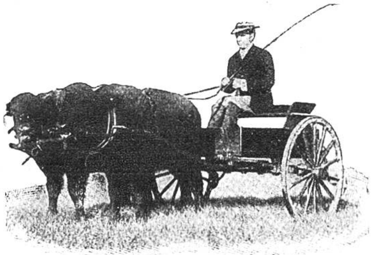
Das erste Büffelgespann.

Der Büffel wurde von Weissen zuerst in Anahuac, der Hauptstadt der Azteken, in Mexiko gesehen, es war im Jahre 1521 als der Eroberer Cortes und sein Gefolge die Menagerie des Königs Montezuma besuchten. Ein schiffbrüchiger, spanischer Matrose sah im Jahre 1530 im südlichen Texas zuerst wilde Büffel. Sie waren früher über ein Drittel des nordamerikanischen Kontinents verbreitet. Wenn die grossen Her-