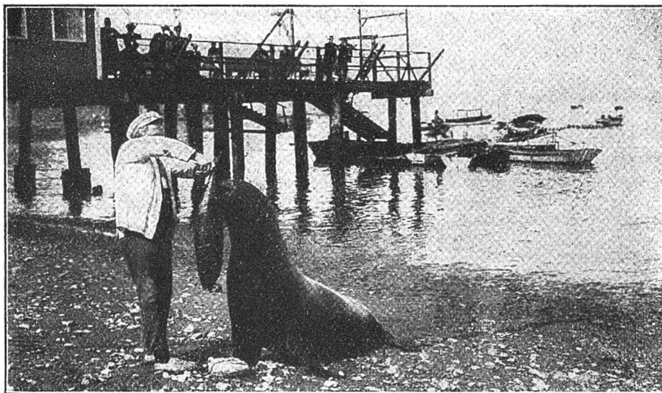
Fütterung eines Seelöwen