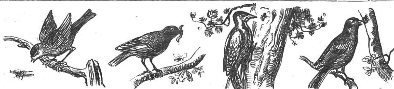
Meise. Fr. 30.—