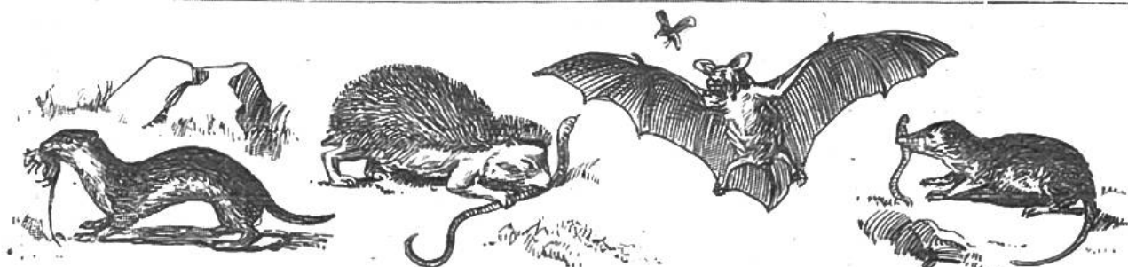
Gr. Wiesel. Fr. 40.—