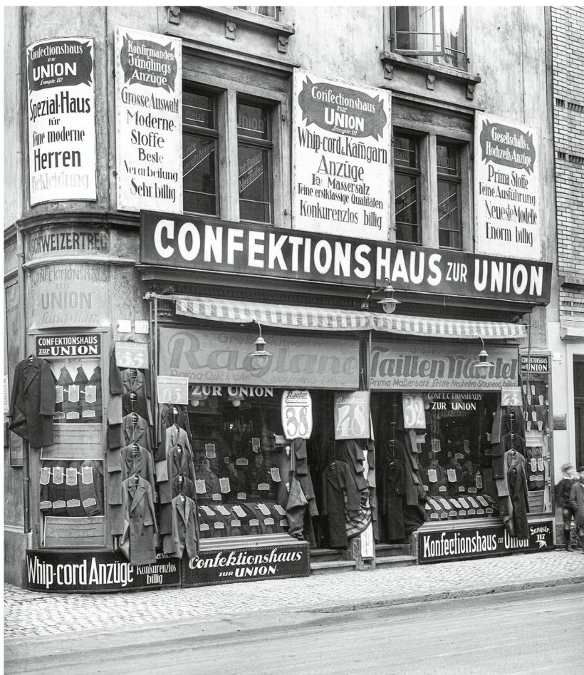
Das «Konfektionshaus zur Union» an der Langstrasse 117 im Zürcher Kreis 4 kam seiner Kundschaft betont volkstümlich und in preisgünstiger Anmutung entgegen.