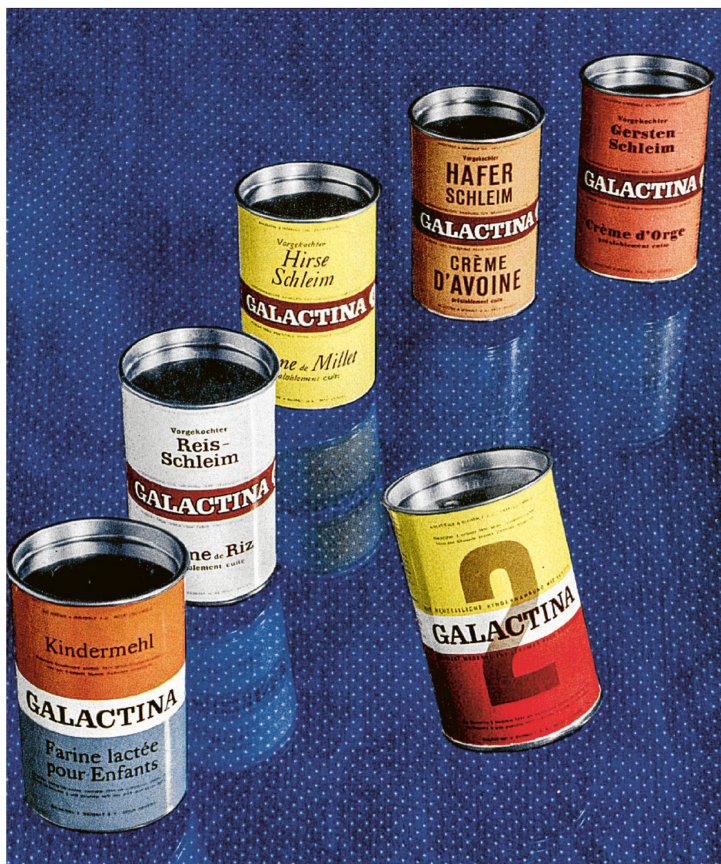
Kindermehl und andere Kindernährmittel von Galactina Belp.

Die Gesellschaft unter ihrem Präsidenten Bangerter ging ihr Geschäft aktiv an und setzte von Anfang an auf Wachstum. Unverzüglich wurden das Fabrikgebäude, die Einrichtungen und die Rechte zur Produktion des Kindermehls erworben. Der noch heute gängige Name Galactina lehnt sich an das griechische Wort gala an, was auf Deutsch «Milch» bedeutet, der Hauptbestandteil des Kindermehls. Ab 1904 gab man die Zeitschrift «Mutter und Kind», im französischen Sprachraum «Bébé» und im italienischen Sprachraum «Madre e Bambino» genannt, heraus. Ab 1906 wurde der Galactina-Hafermilch-Kakao vertrieben und im gleichen Jahr auch mit dem Export nach Argentinien und Chile begonnen. 1911 erwarb man von Biomalz Teltow in Berlin die Lizenz zur Produktion und zum Vertrieb des Kräftigungsmittels Biomalz in der Schweiz. Das seither als Galactina & Biomalz AG bekannte Unternehmen war damit sehr gut auf dem Schweizer Markt positioniert.