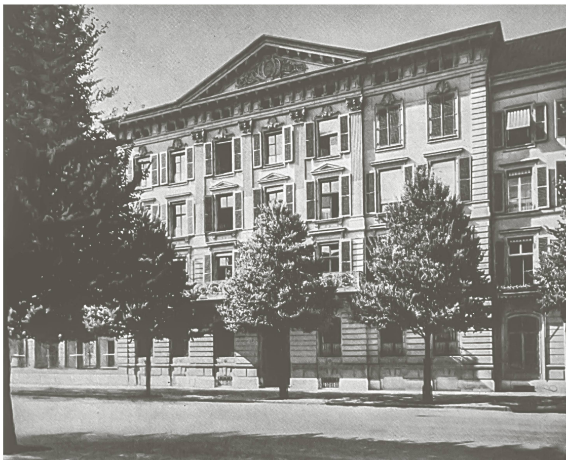
Der Hauptsitz der Kantonalbank von Bern von 1867–1906 an der Bundesgasse 8 in Bern.

Ein Wirken Gottfried Bangerters im Bankrat der Nationalbank ist, wie gelegentlich behauptet wird, nicht belegt. Die Jahresberichte 1907/08 und 1909 bis 1923 nennen den Namen Bangerter unter den Bankräten nicht.