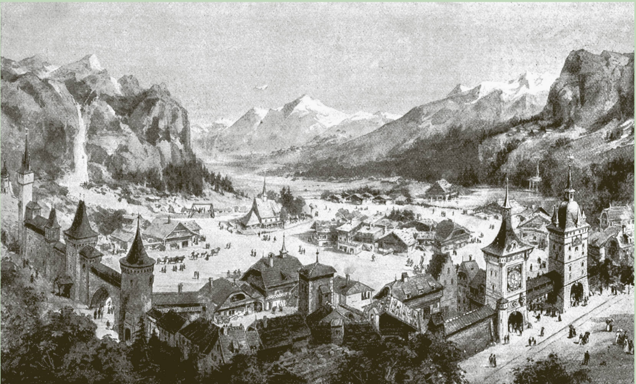
Das «Village Suisse» an der Pariser Weltausstellung von 1900. Das aufwendig inszenierte Touristen-Bergdorf wird als Attraktion gefeiert.

Im November schliesst die Weltausstellung nach sieben Monaten ihre Tore. Rund 50 Millionen Menschen haben die Ausstellung besucht sowie den Fortschritt und Optimismus der Zeit gesehen. Dieser Zeitgeist lässt auch Gottfried Bangerter erkennen, der eben nach Bern gezogen ist. Voller Tatendrang führt er zahlreiche Firmen zum Erfolg und verhilft so einer ganzen Volkswirtschaft zu Wachstum.