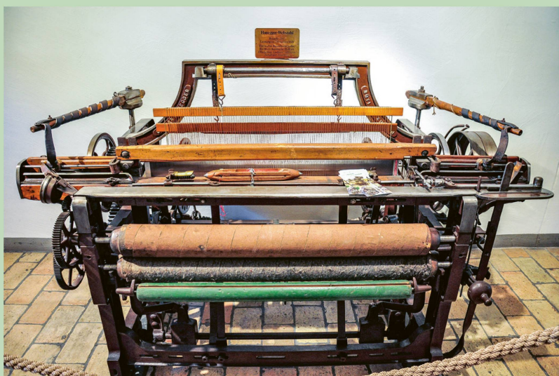
Ein Honegger-Webstuhl von 1860.