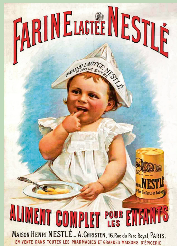
Werbeplakat für Nestlé Kindermehl um 1900.