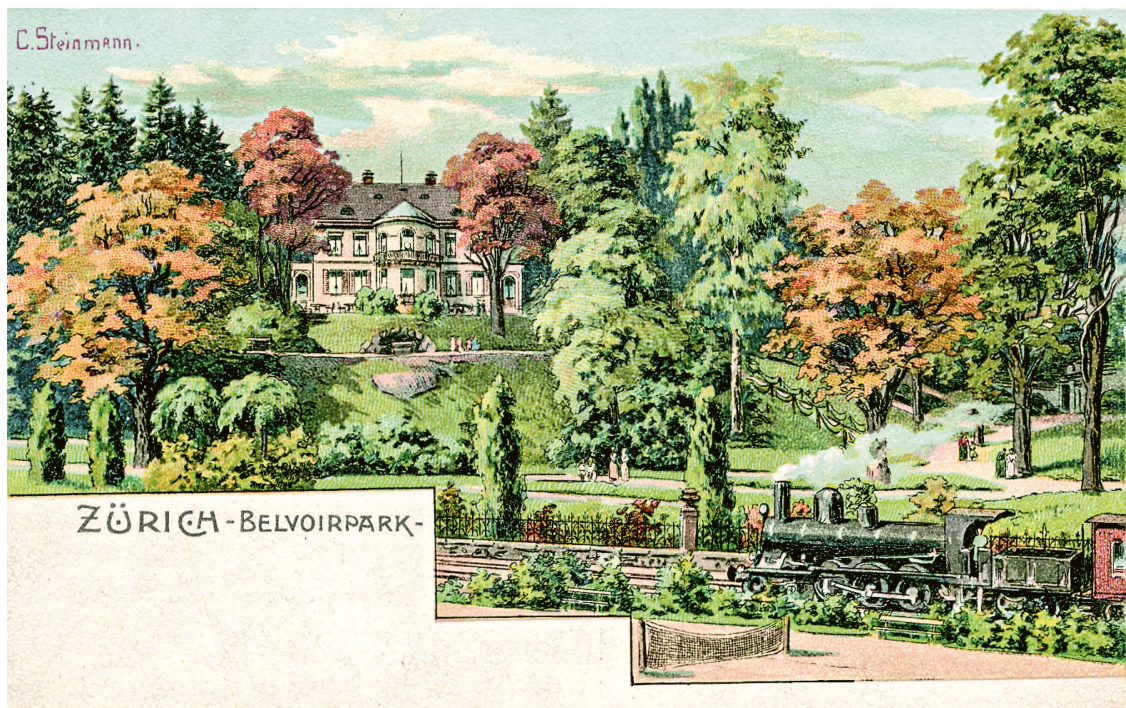
Die Bahnlinie, die Zürich ab 1875 über das linke Seeufer mit dem Glarnerland verband, durchquerte Alfred Eschers prächtige Belvoir-Parklandschaft.

denbock zu stempeln für alles und jedes. Namentlich wurde er dafür verantwortlich gemacht, dass die Aktienkurse der Bahngesellschaften in den Keller getaucht und Obligationen auf Tiefstwerte gesunken waren. Als ob er selbst die Wirtschaftskrise, die ganz Europa erfasste, ausgelöst hätte. Von allen Seiten hereinbrechende Beschuldigungen und nicht enden wollende Verunglimpfungen prallten an Escher nicht einfach ab. Die unermessliche Fülle von Belastungen und Überanstrengungen führte dazu, dass er nach dem Auftritt im Zürcher Kantonsrat vom März 1878 so schwer erkrankte, dass er während rund zwei Monaten kaum mehr in der Lage war, das Belvoir zu verlassen. Überreizte Nerven und Fieberschübe fesselten ihn ans Bett.