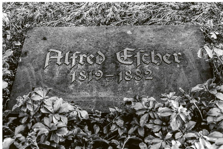
Grabstätte von Alfred Escher auf dem Friedhof Manegg in Zürich.